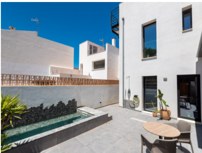
Innenhof mit Pool