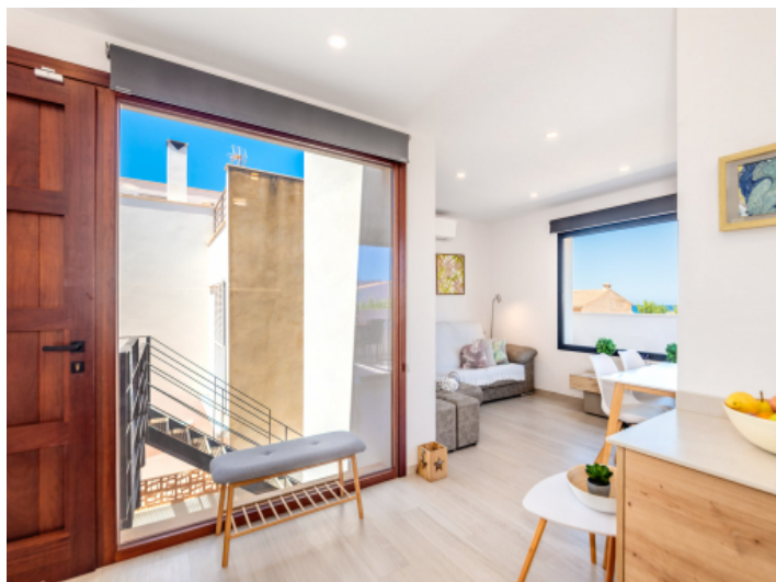
Eingangsbereich auf der oberen Etage