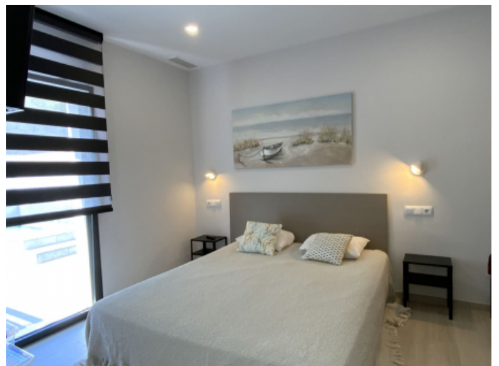
Eines von 3 Schlafzimmern im Erdgeschoss