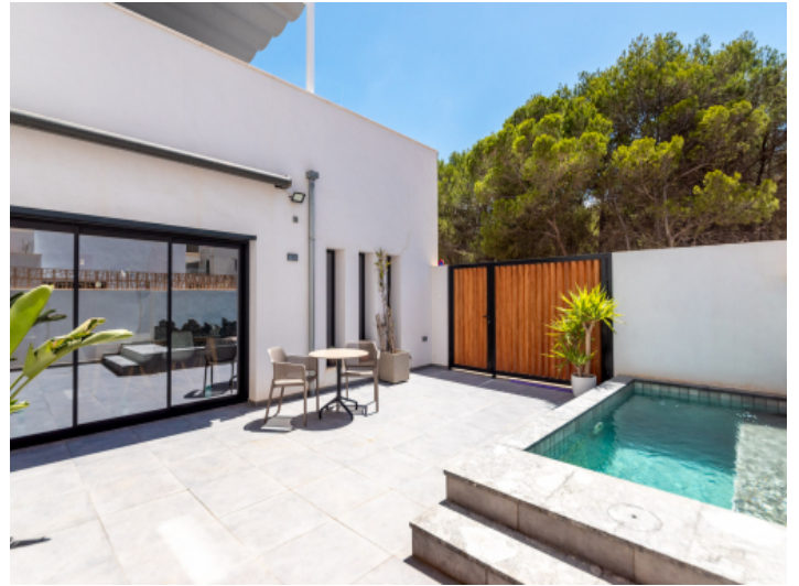
Innenhof mit Pool