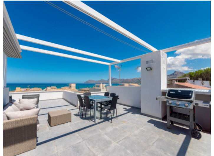
Dachterrasse mit BBQ und Meerblick