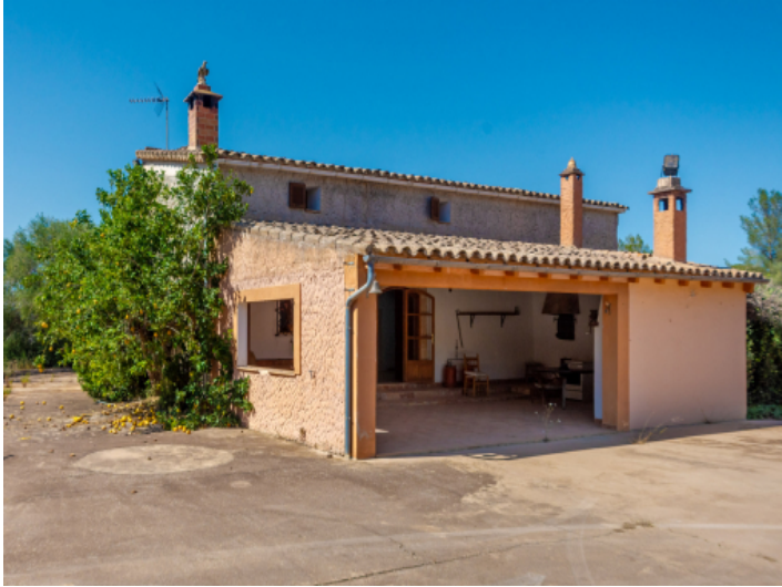
Haus, Sant Joan