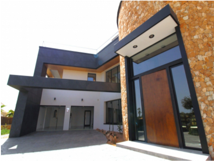
Ansicht auf das Haus