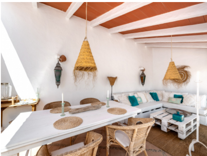
Terrasse und Loungebereich