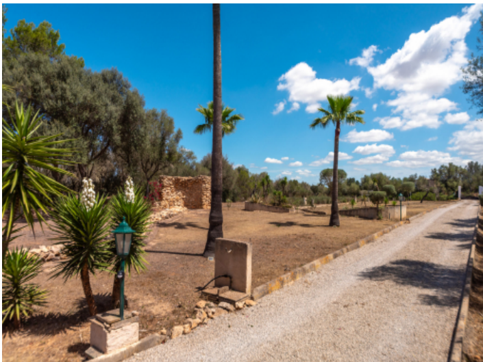
Zugang zur Finca