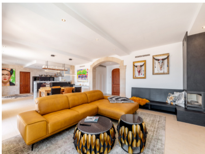
Wohnbereich mit Kamin