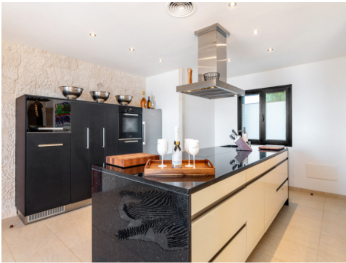
Küche mit Kochinsel