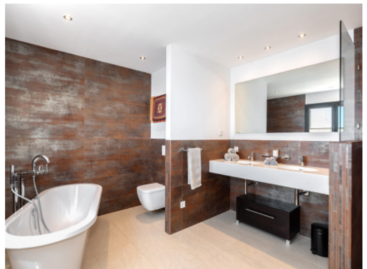
Bad en Suite