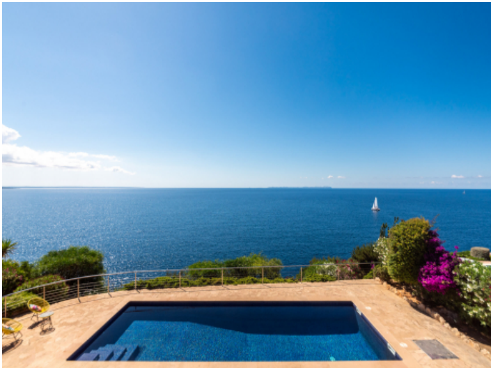
Poolbereich mit auf das blaue Mittelmeer