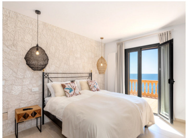
Alles Schlafzimmer mit Bad en Suite