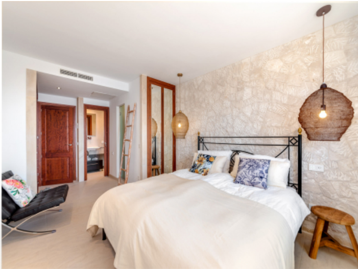
Schlafzimmer mit Bad en Suite