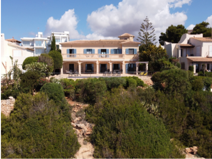
Ansicht auf die Villa