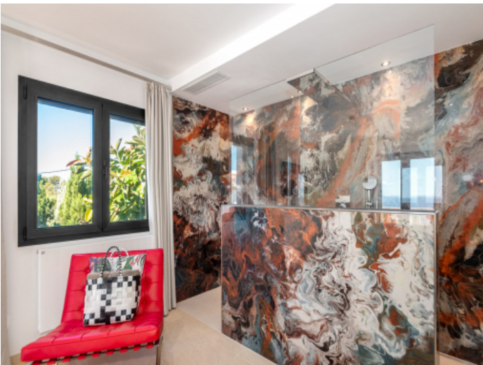
Badezimmer en Suite