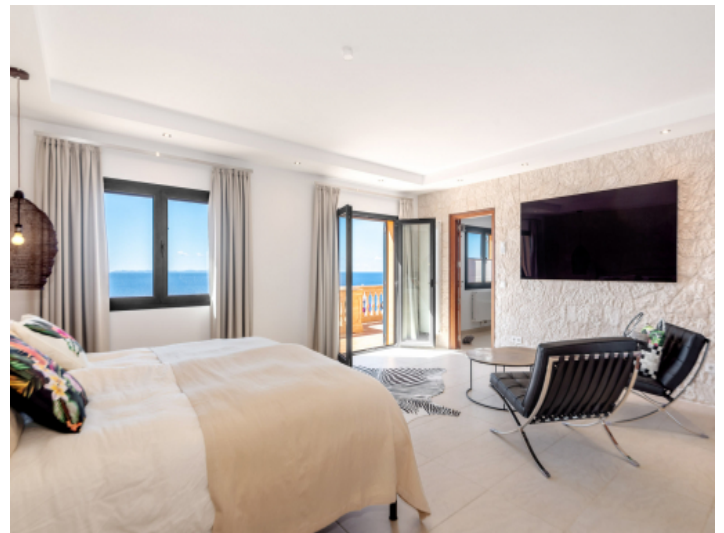
Mastersuit mit Bad en Suite