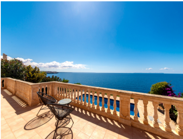
Terrasse auf der 1. Etage