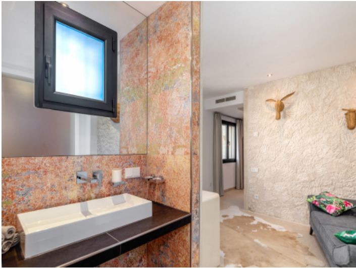
Badezimmer en Suite