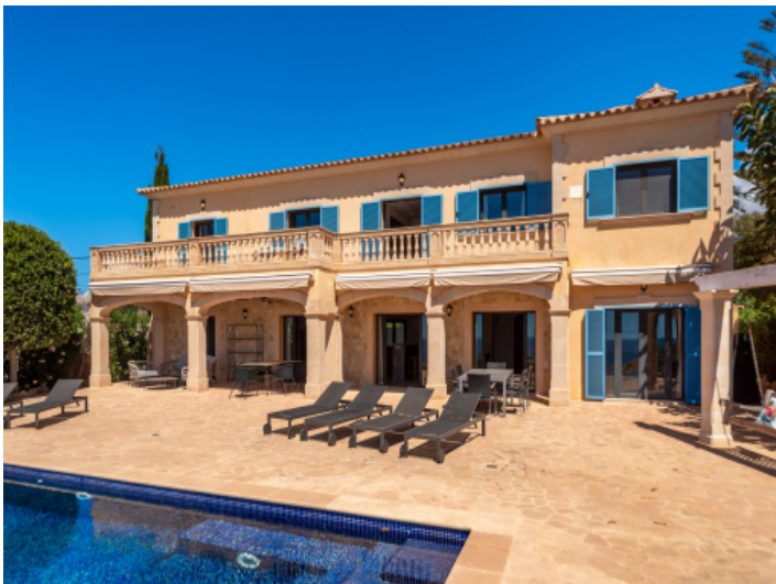
Ansicht auf das Haus