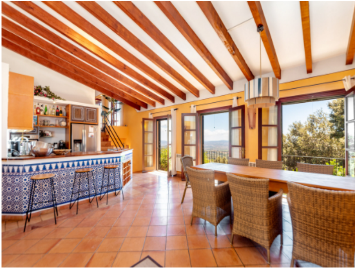
Küche im Landhausstil