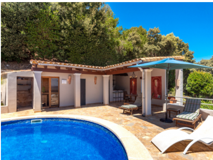
Poolhaus und Sauna