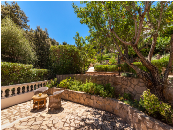
Sehr gepflegte Grünzonen