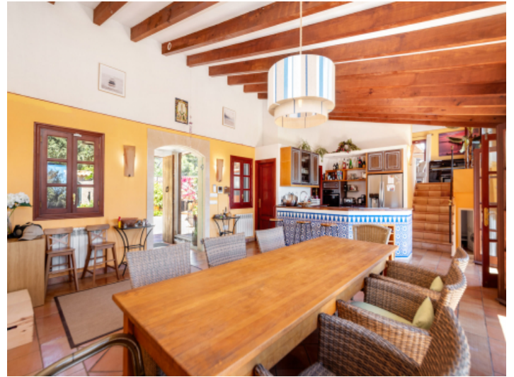
Viel Tageslicht und hohe Decken mit Holzbalken