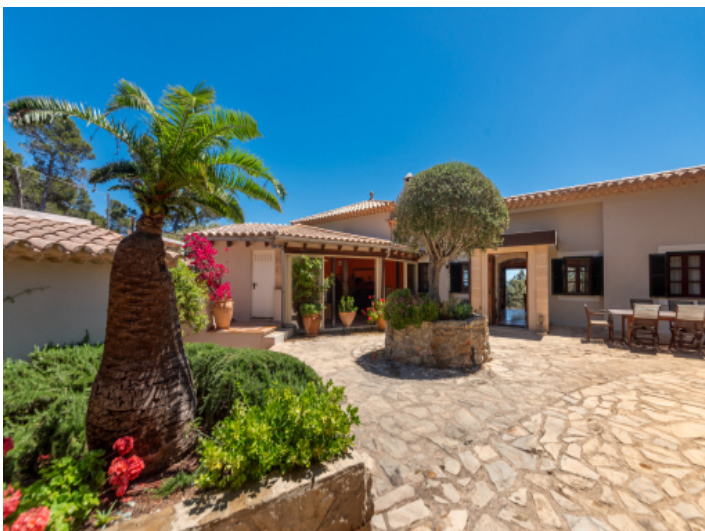
Naturstein geplasteter Eingangsberich