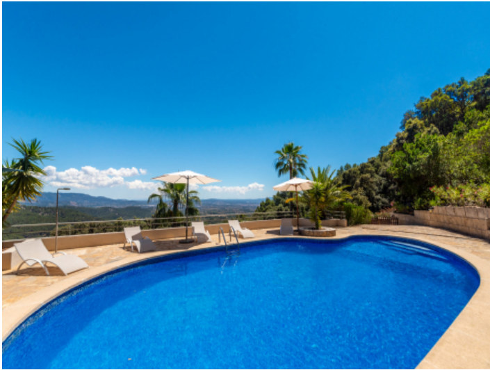
Pool mit Weitblick