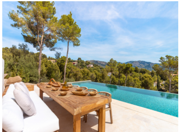
Umgeben von Natur