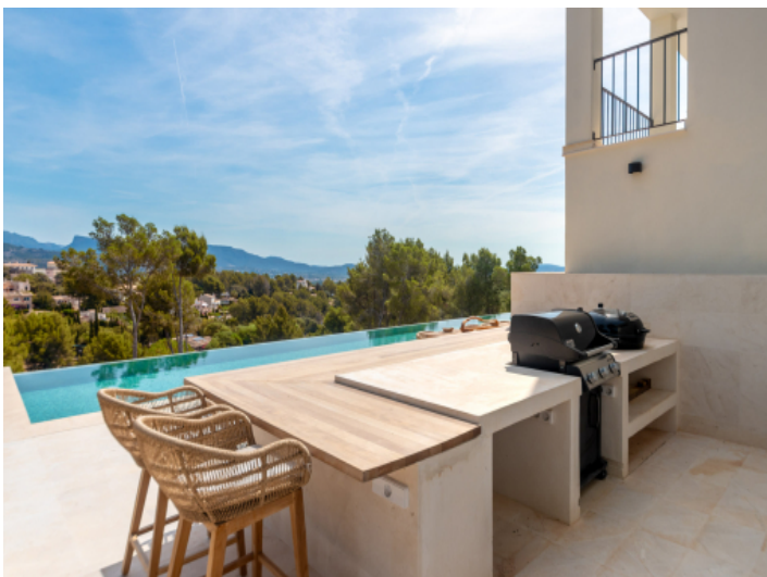
Grillbereich am Pool