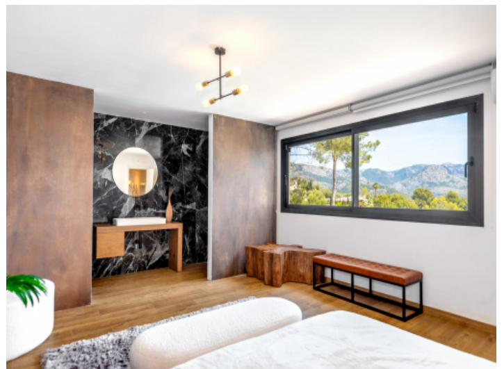
Schlafzimmer mit Badezimmer en Suite