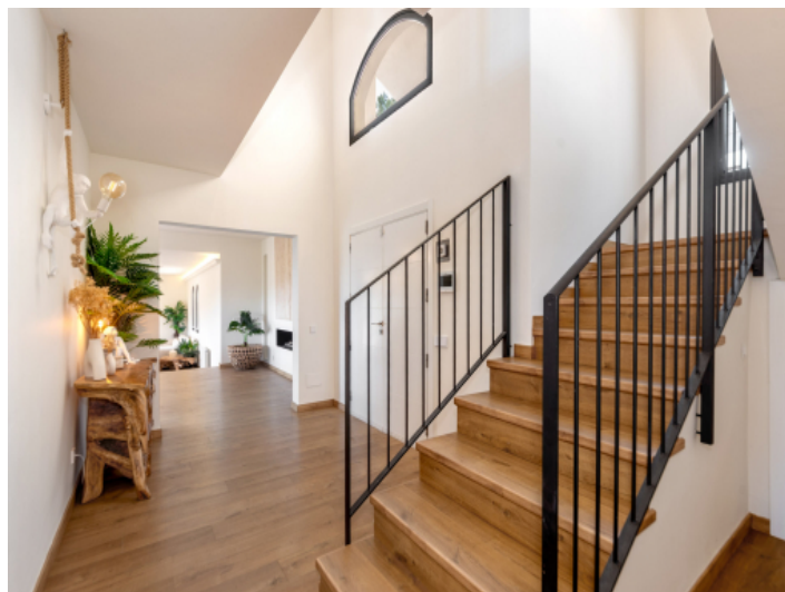
Treppe zur 1. Etage