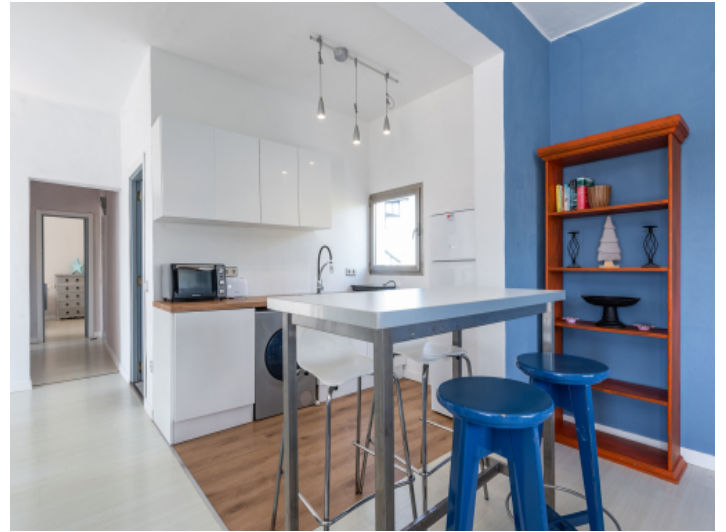
Küche mit Bar