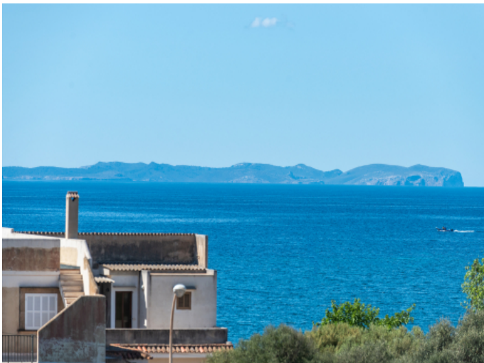
Blick auf das Mittelmeer