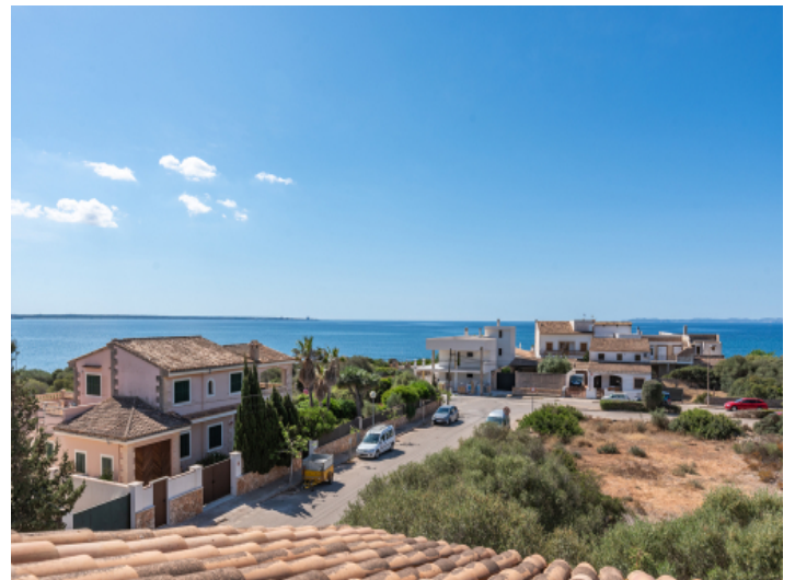
Blick aufs Mittelmeer