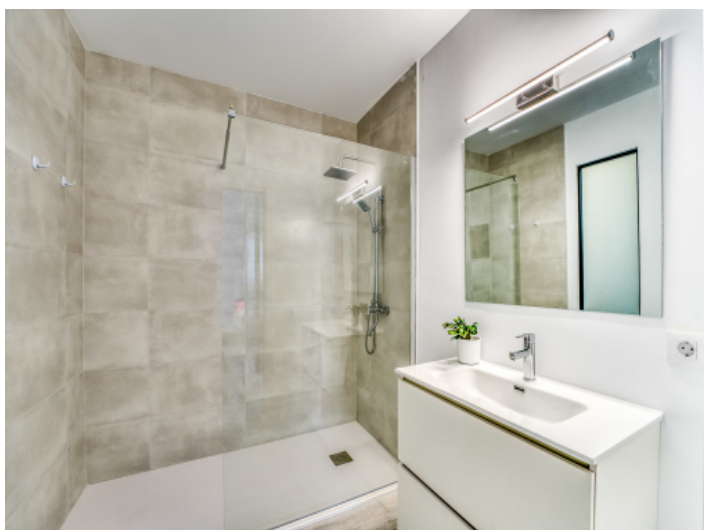
Badezimmer mit bodentiefer Dusche