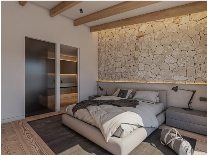
Edel saniertes Dorfhaus mit Pool und Garten in Alaró