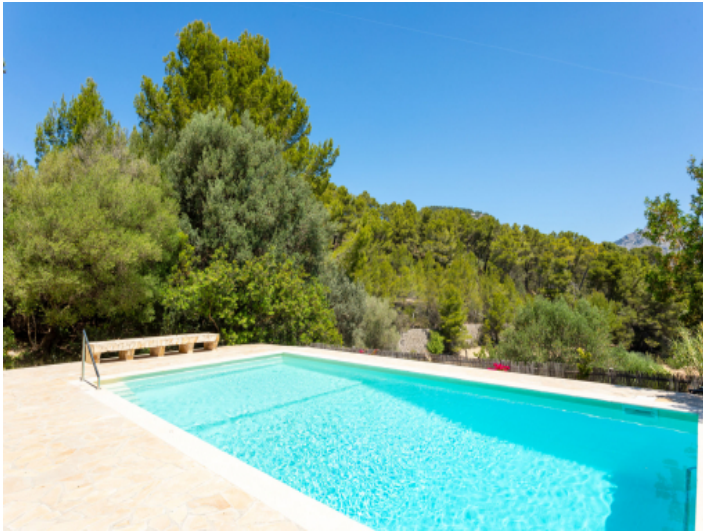
Ruhiges freistehendes Einfamilienhaus mit Potential in Es