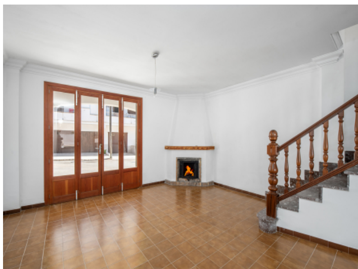
Eingangsbereich mit Kamin