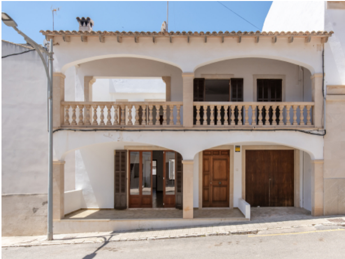
Fassade im mallorquinischem Stil