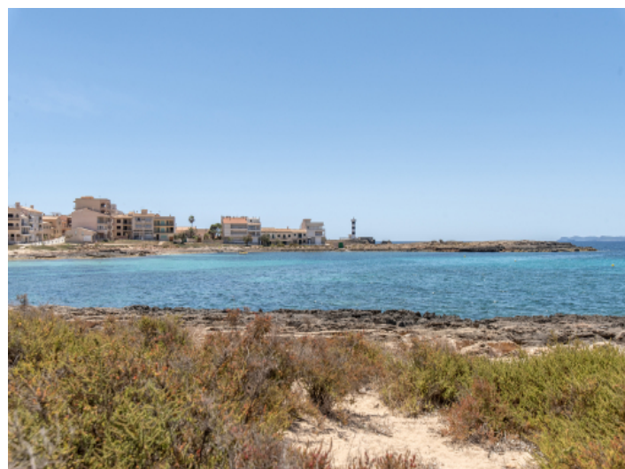
Colonia St. Jordi