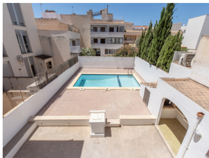
Aussicht auf den Patio