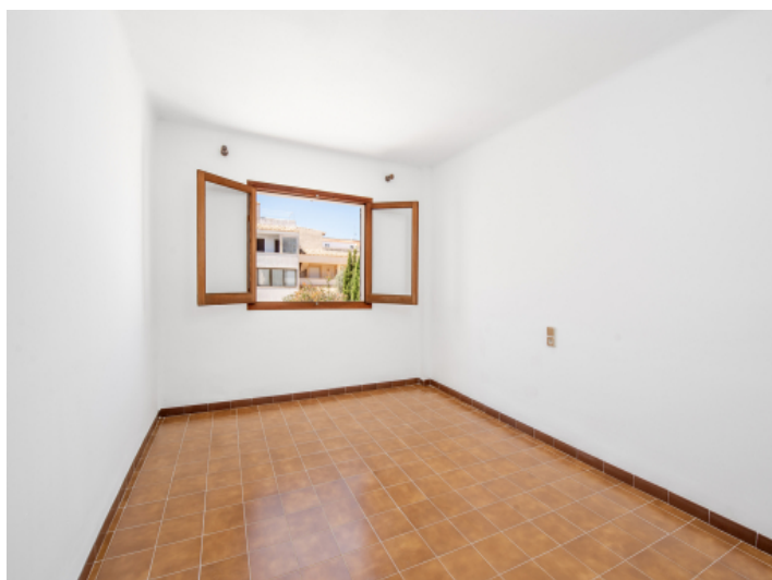
Eines von 5 Schlafzimmer