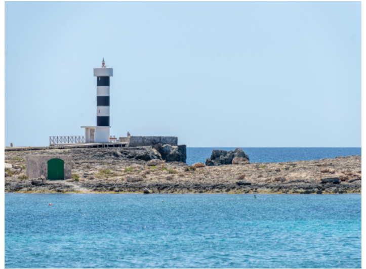
Leuchtturm Cala Gaviota