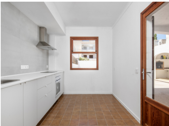
Küche mit direktem Anschluss an die Terrasse