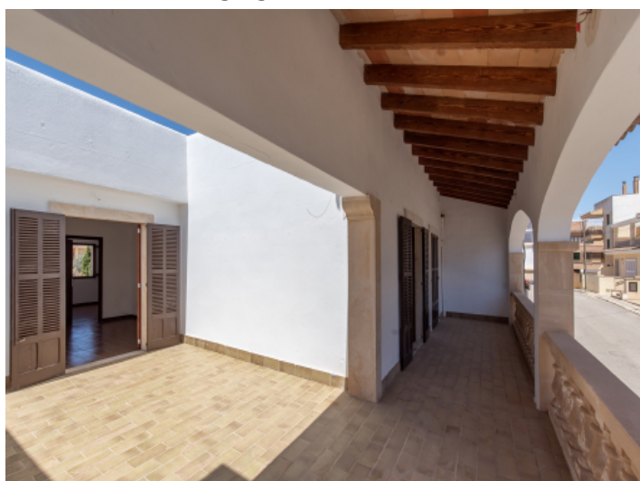
Obere Etage mit weitläufiger Terrasse