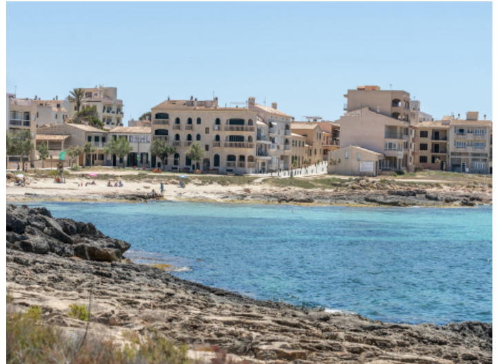
Cala Gaviota ist in unmittelbarer Nähe