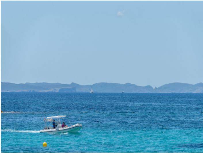
Weitblick vom Strand bis nach Cabrera