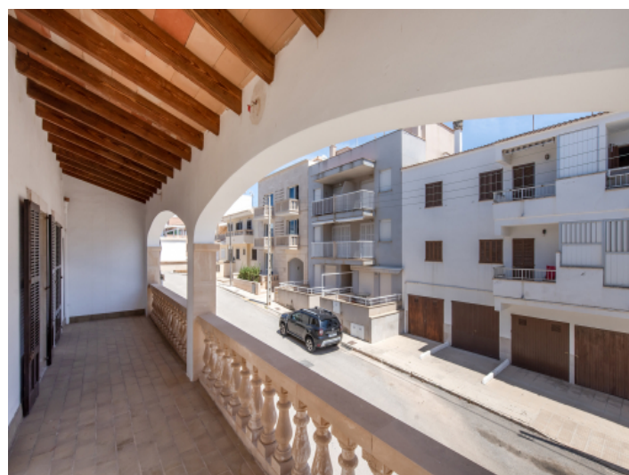
Ausblick auf die Nachbarschaft