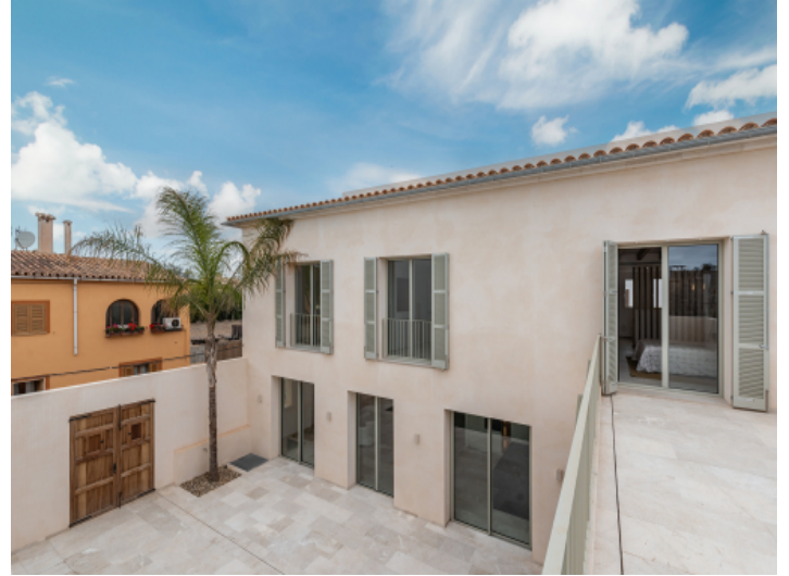
Fantastischer Innenhof mit Privatsphäre