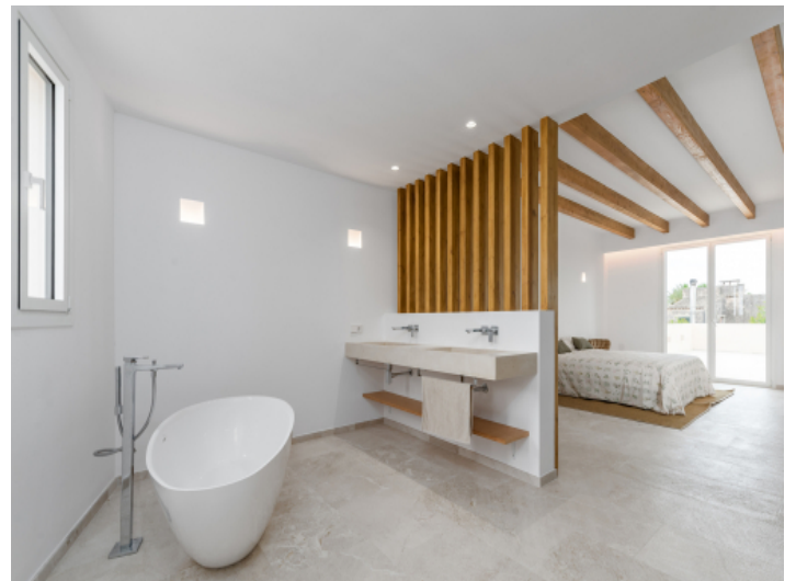
Mastersuit mit Badezimmer