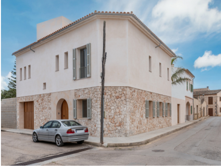
Ansicht auf das Stadthaus