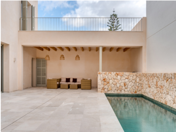
Patio mit Pool