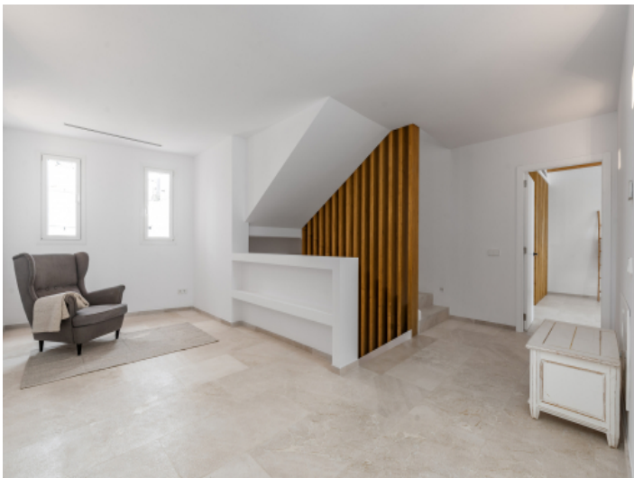
Flur im OG