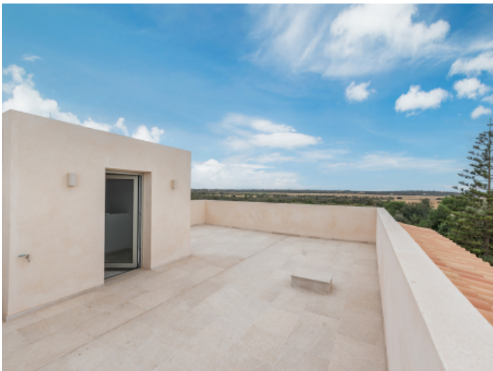
Terrasse im Obergeschoss