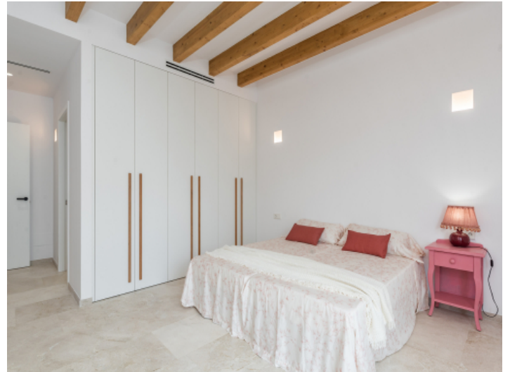
Alle Schlafzimmer mit Badezimmer en Suite