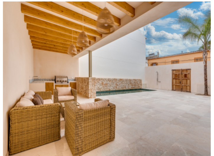
Überdachte Terrasse im Innenhof