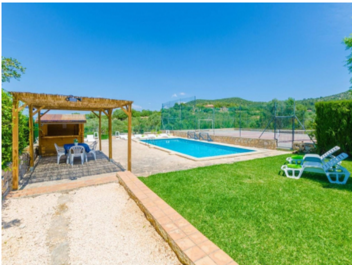
Garten und Pool