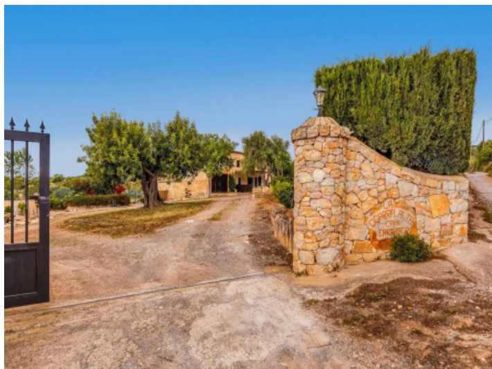
Auffahrt zur Finca