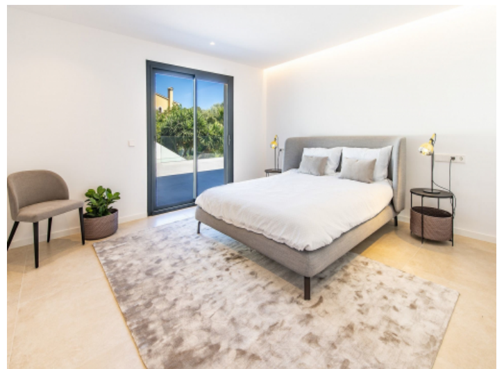
Eines von 6 Schlafzimmern