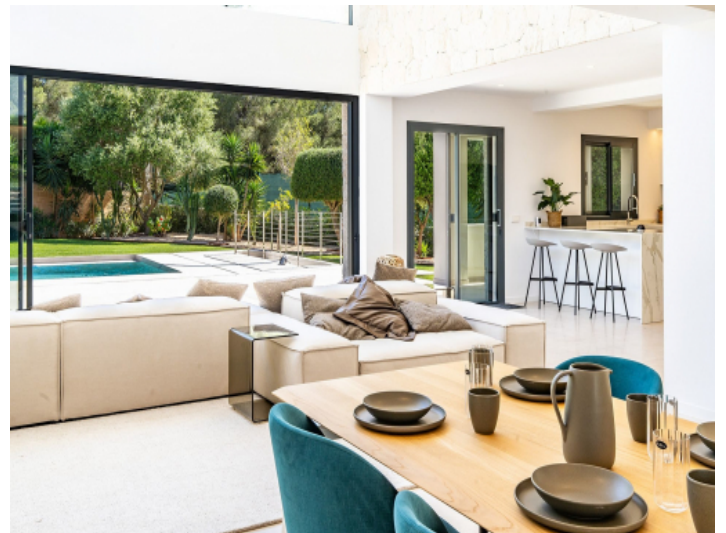
Wohn und Essbereich