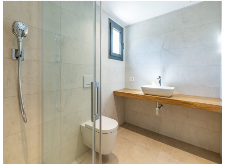
Eines von 6 Badezimmern