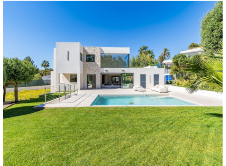
Traumhaus in Santa Ponsa