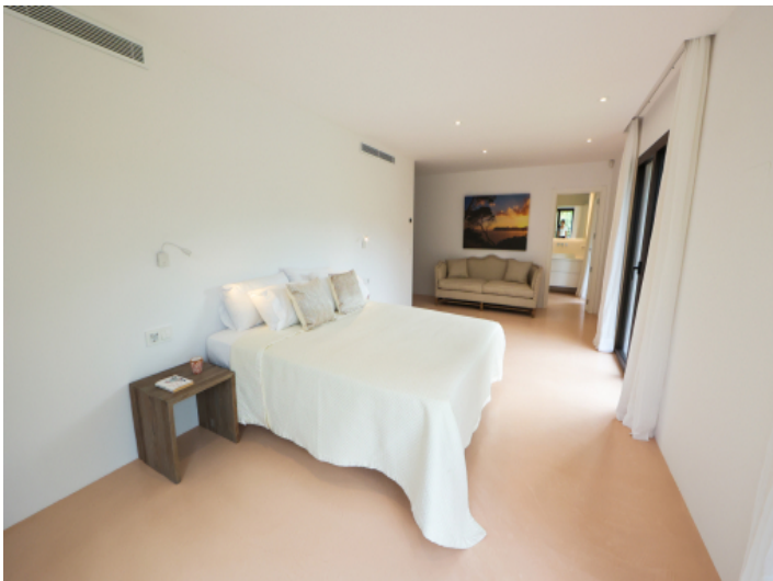
Eines von 7 Schlafzimmer