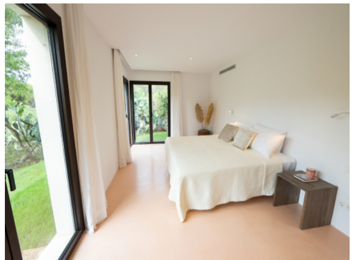
Schlafzimmer mit Gartenblick