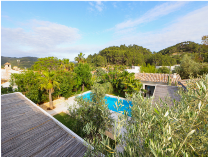
Aussicht auf den Garten