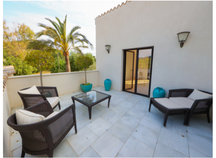
Private Terrasse eines Schlafzimmers