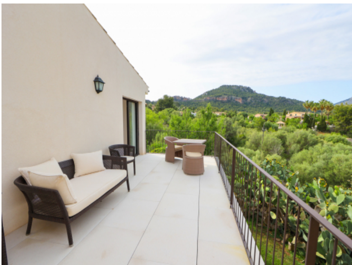
Terrasse auf der oberen Etage