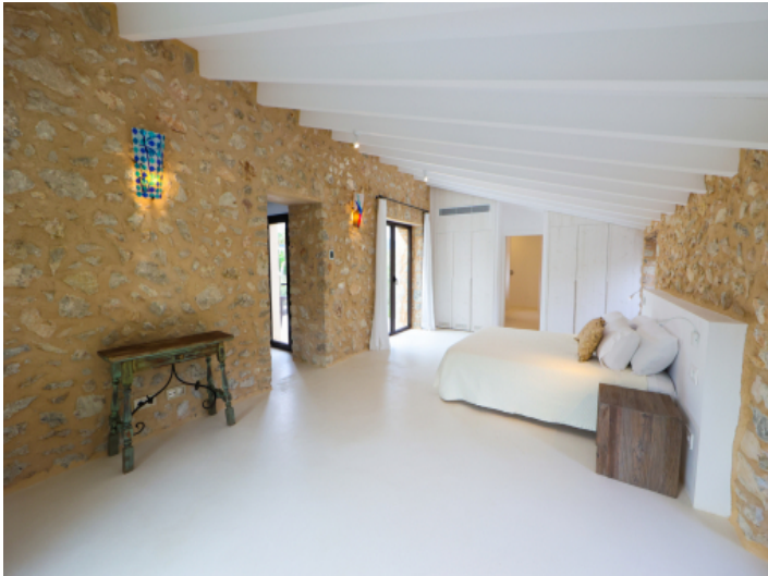
Schlafzimmer auf der 1. Etage