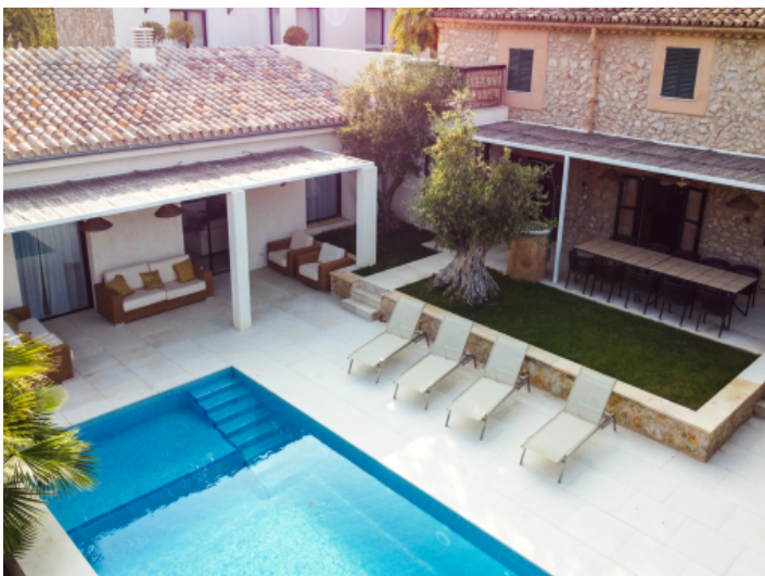
Ansicht auf den Pool