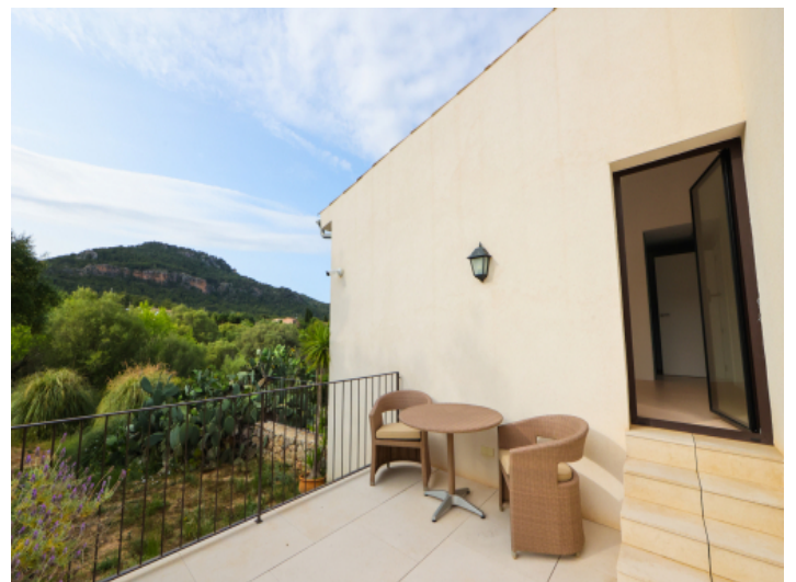
Eine weitere Terrasse