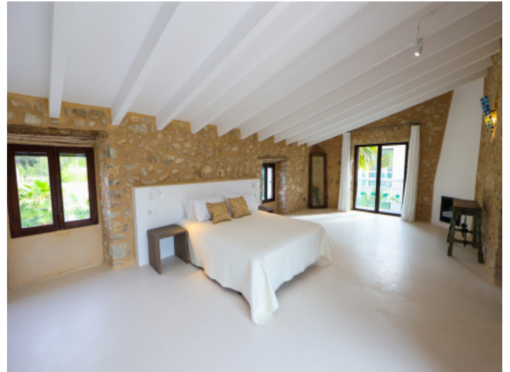
Natursteinwände verleihen viel Gemütlichkeit