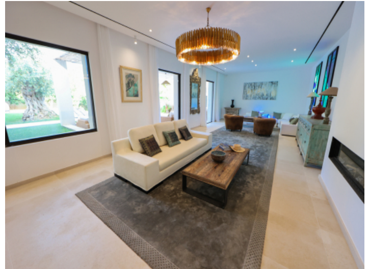
Wohnbereich mit Kamin