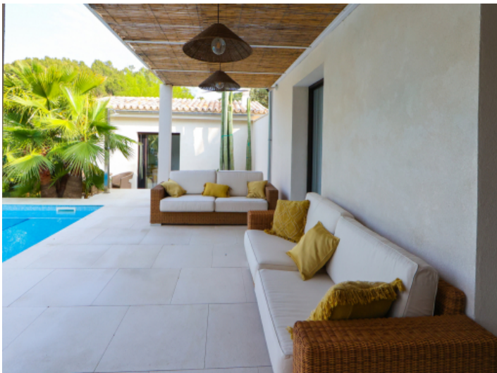
Chillout am Pool