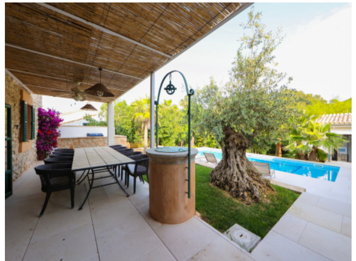
Großer Outdoor Essbereich