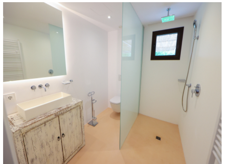
Eines von 9 Badezimmern