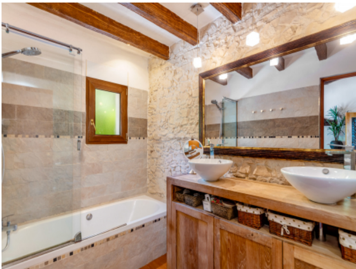
Eines von 4 Badezimmern