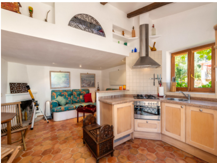
Küche im Gästehaus