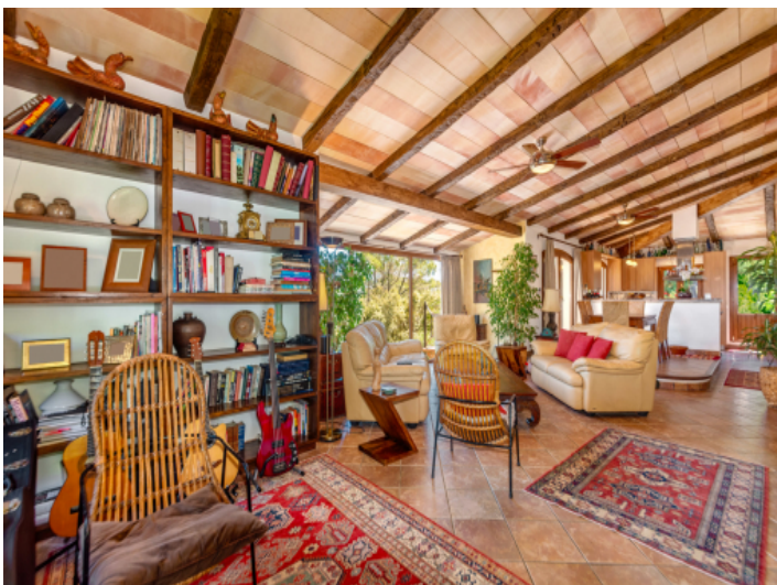
Wohn und Essbereich