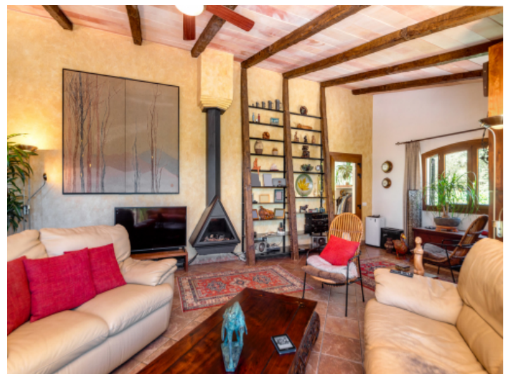
Wohnbereich mit Kamin