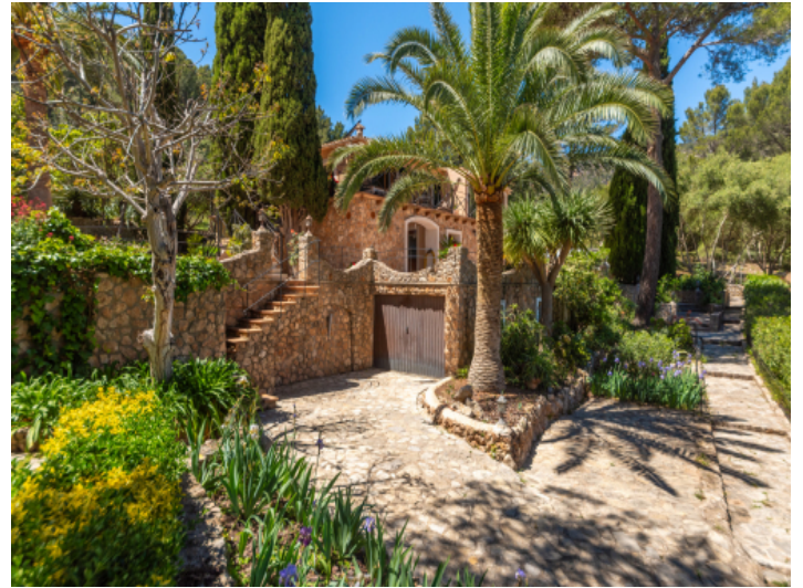
Gewachsener mediterraner Garten