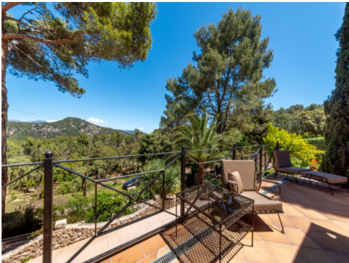
Traumblick auf die Natur