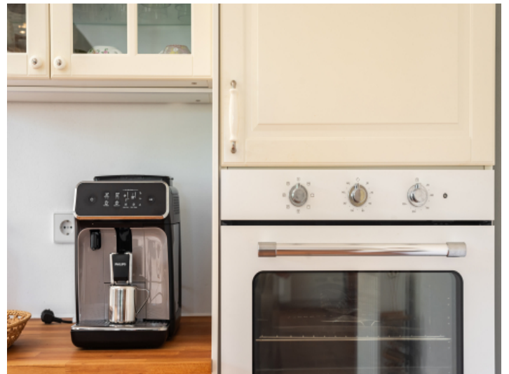
Details der Küche