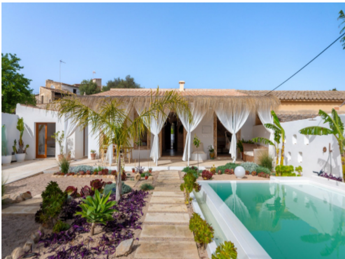
Tolle Villa mit Pool und Garten in Establiments