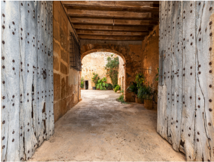
Zugangstor zum Innenhof