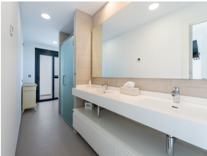
Eines von 3 Badezimmern