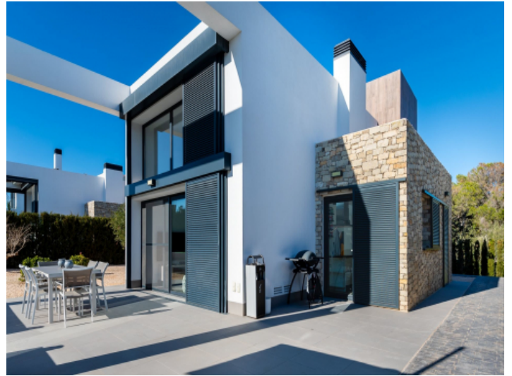
Außenansicht und Terrasse