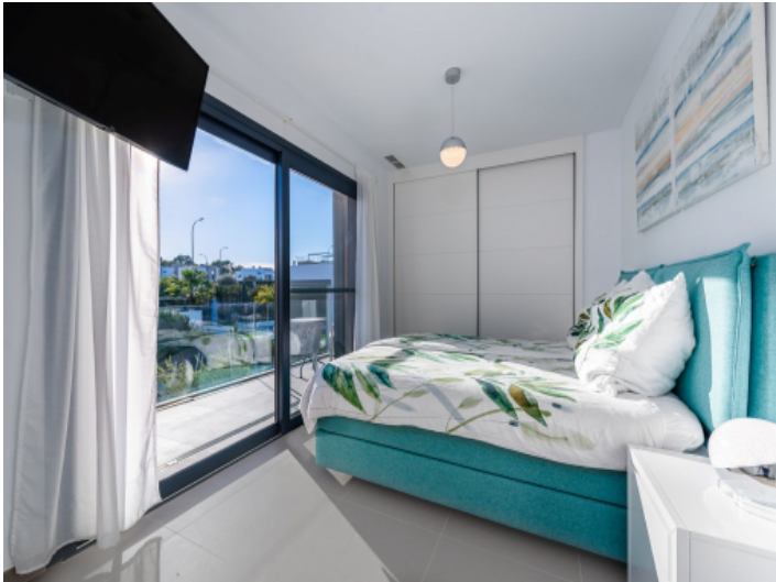
Schlafzimmer im Obergeschoss