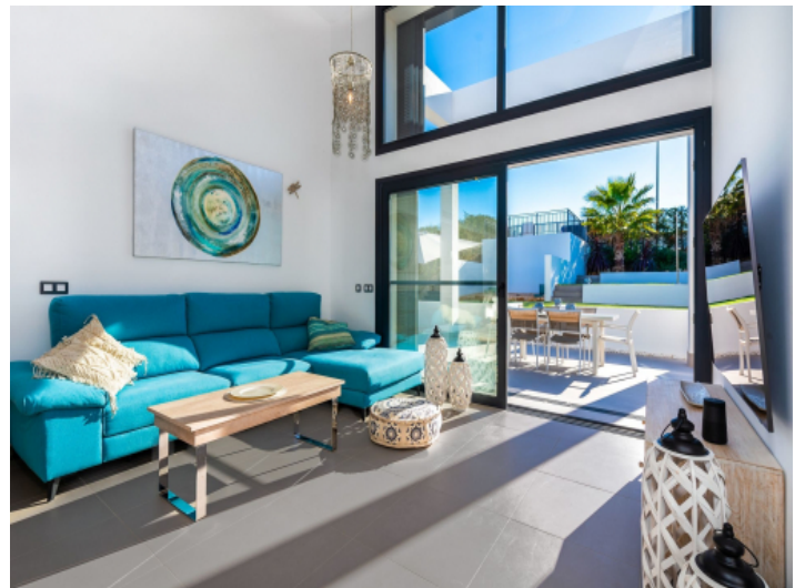
Wohnbereich mit Fensterfront