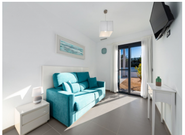
Schlafzimmer mit Terrassenzugang