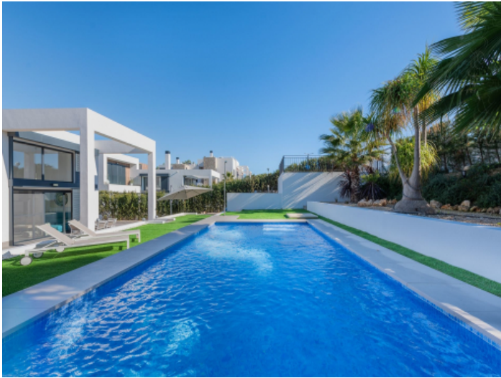
Großer Pool mit Sonnenterrasse