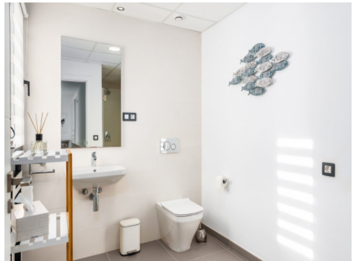
Eines von 3 Badezimmern