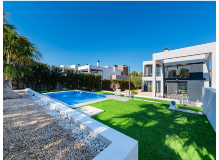
Pool und Außenbereich