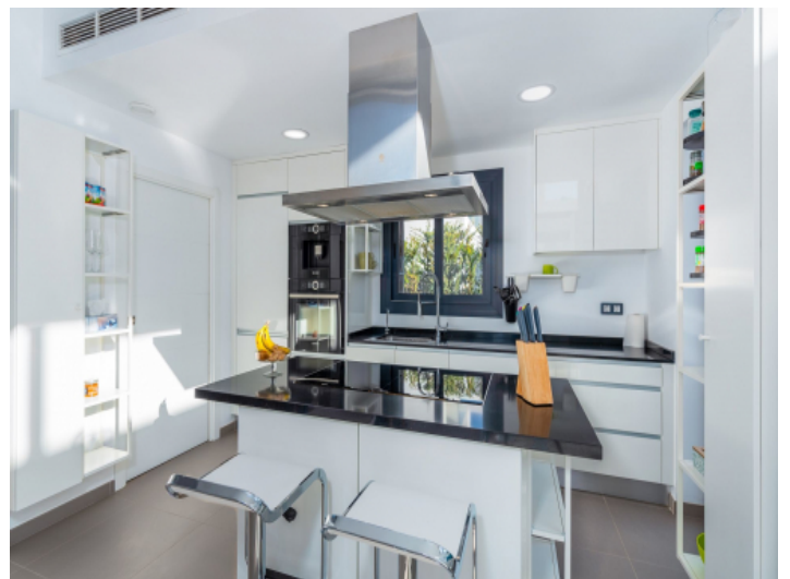
Moderne Amerikanische Küche