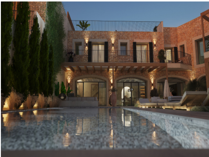
Toscanische Gartenatmosphäre mit beheizbarem Pool