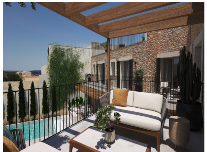
Private Terrasse der Mastersuite