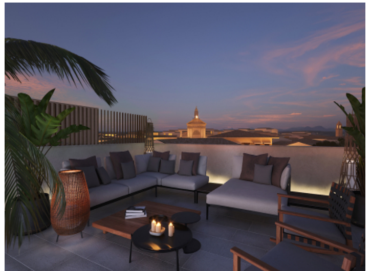
Dachterrasse mit malerischem Ausblick