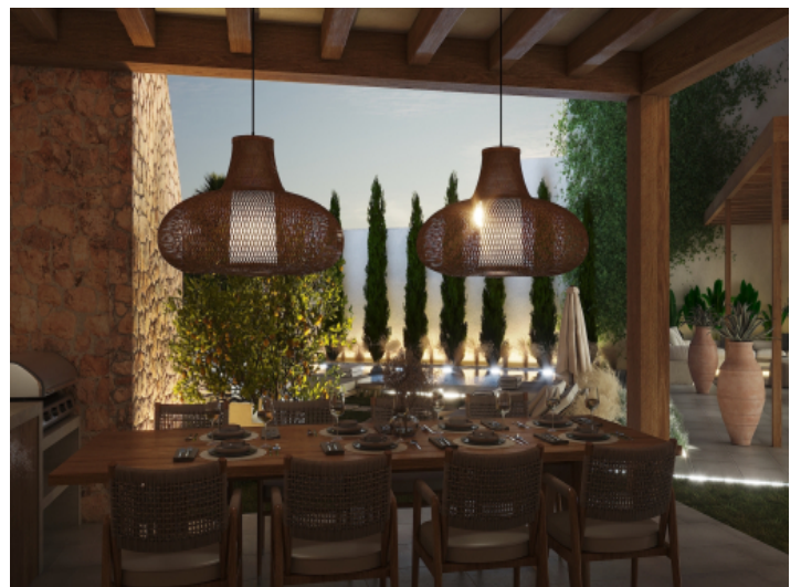
Überdachte Veranda der Aussenküche