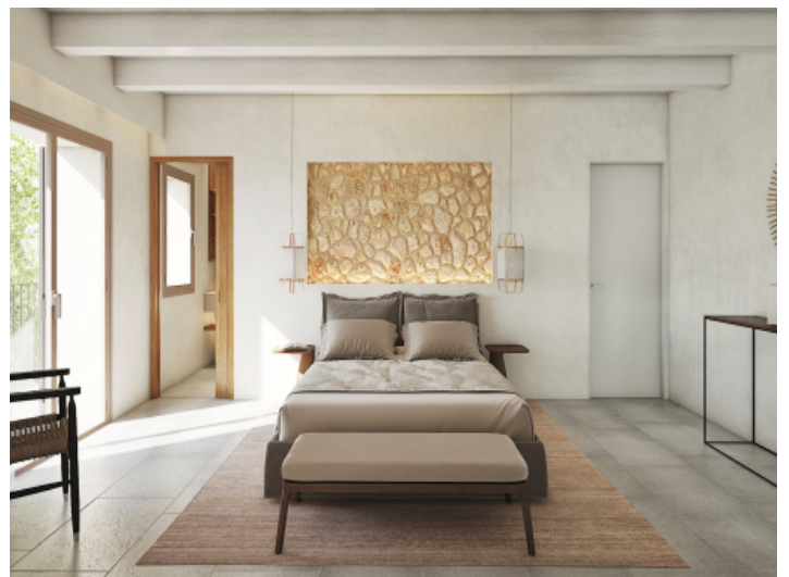
Alle Schlafzimmer mit Bad en Suite