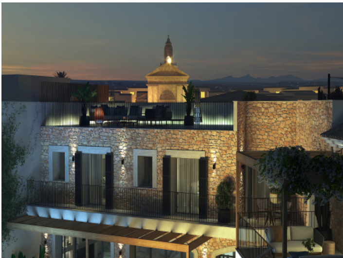
Natursteinfassade ganz nach mallorquinischer Tradition