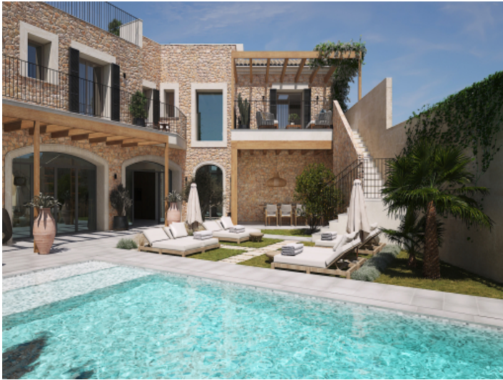
Haus, Ses Salines