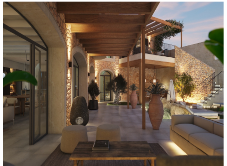
Mallorquinische Tradition trifft auf moderne Architektur