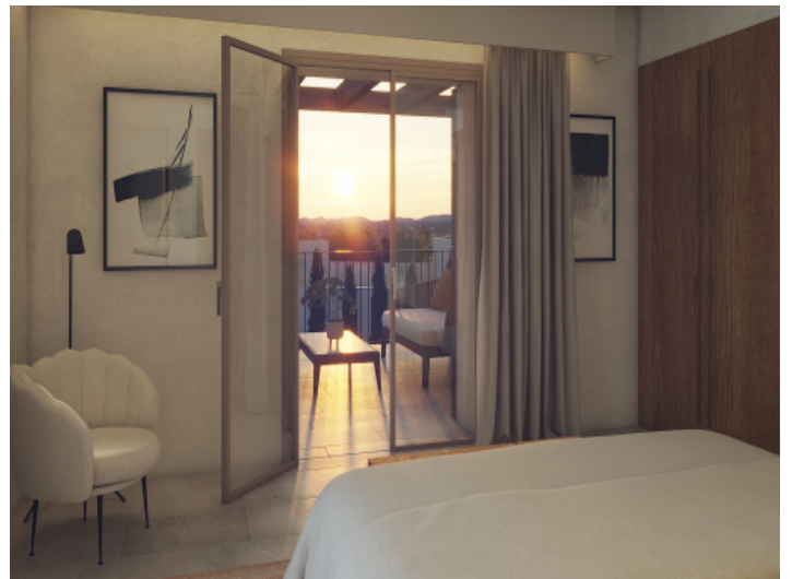
Mastersuite mit privater Terrasse