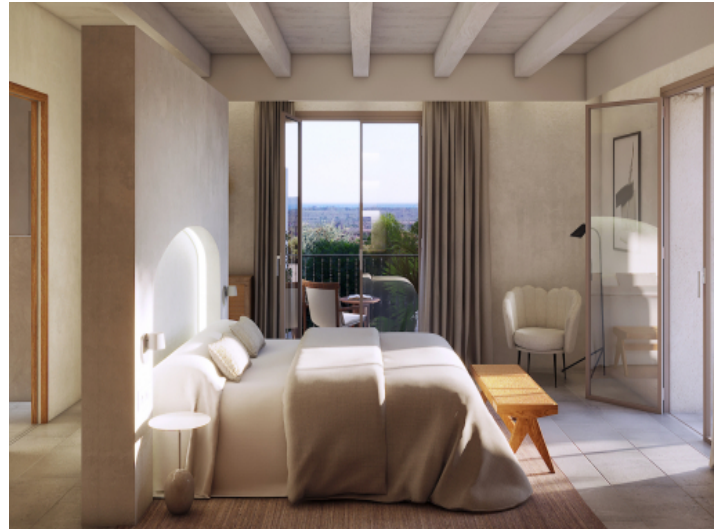
Alle Schlafzimmer mit Badezimmer en Suite