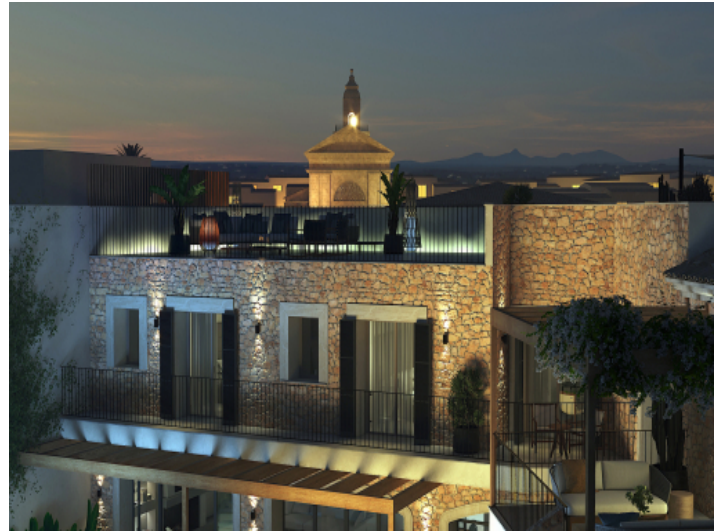
Natursteinfassade ganz nach mallorquinischer Tradition