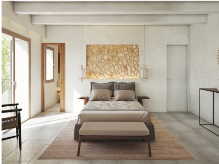
Alle Schlafzimmer mit Bad en Suite