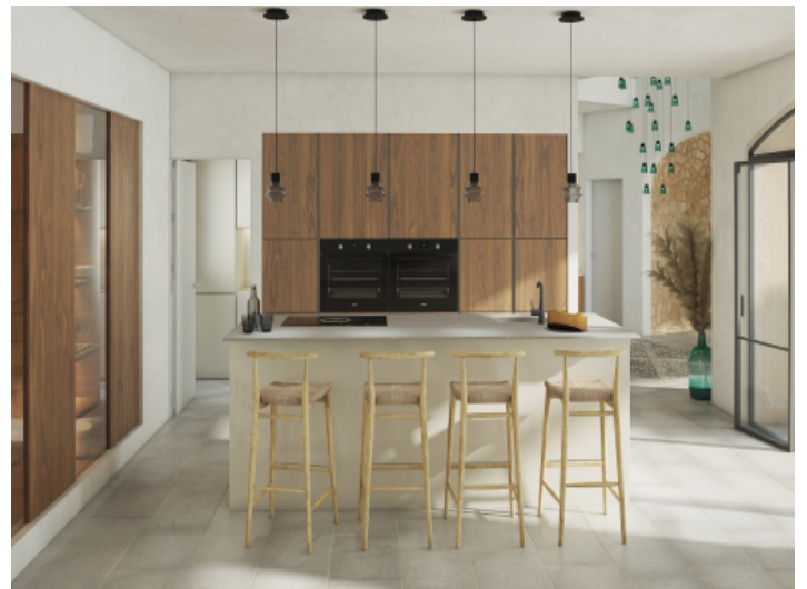
Küche mit gehobener Ausstattung