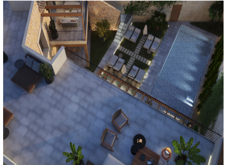
Ansicht von Oben auf das einzigartige Neubauprojekt