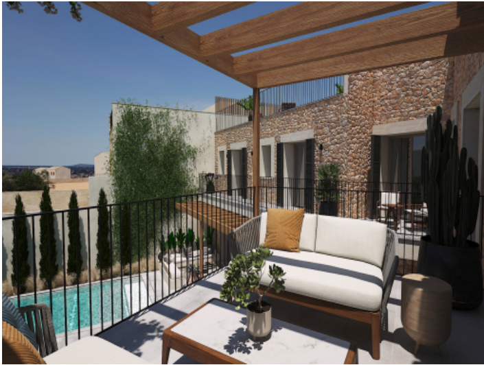
Private Terrasse der Mastersuite