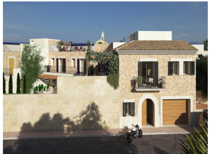
Ansicht auf dieses einmalige Stadthaus