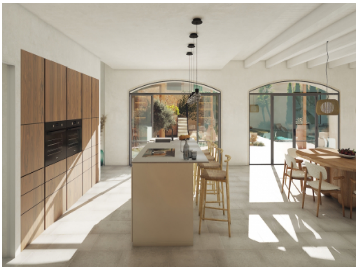
Integrierte Küche mit Kochinsel