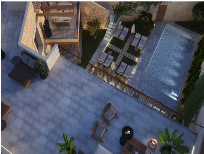
Ansicht von Oben auf das einzigartige Neubauprojekt