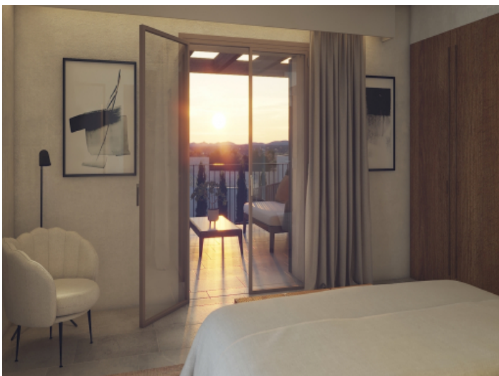
Mastersuite mit privater Terrasse