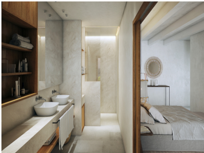
Eines der 4 Badezimmer en Suite