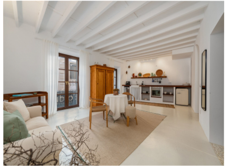
Zweites geschmackvoll renoviertes Apartment