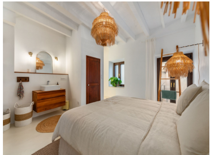
Herrliches Schlafzimmer mit Bad