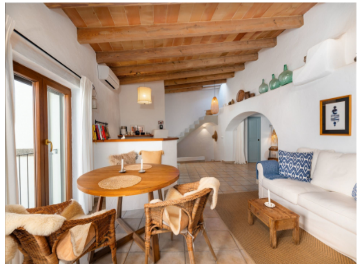
Wohnung mit viel Charakter