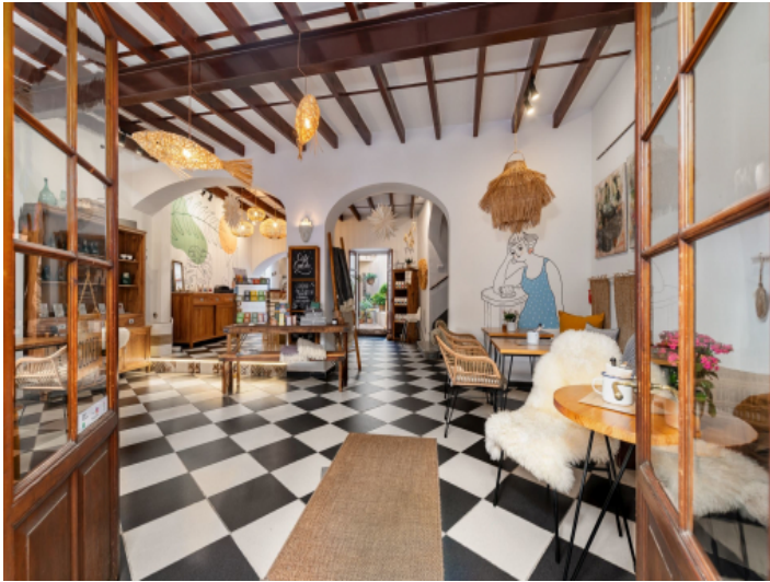
Attraktives Cafe im Erdgeschoss