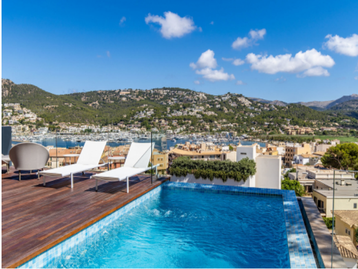
Haus, Puerto Andratx