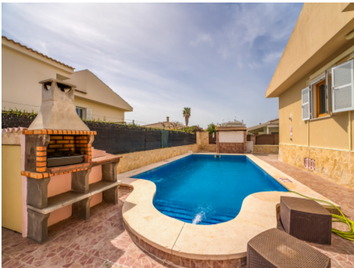
Pool und Grillbereich