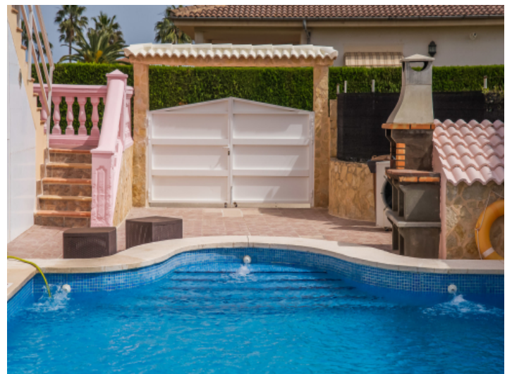
Pool und Eingang