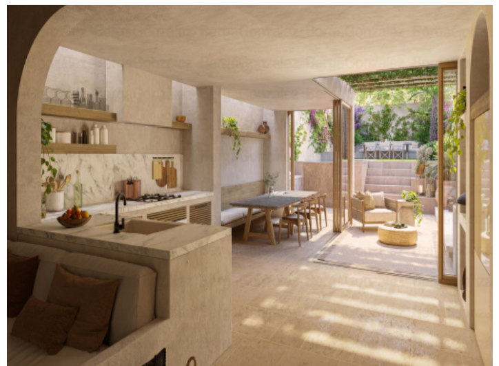
Offene Küche und Essbereich