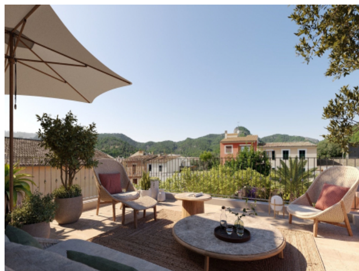
Atemberaubender Ausblick von der Terrasse aus