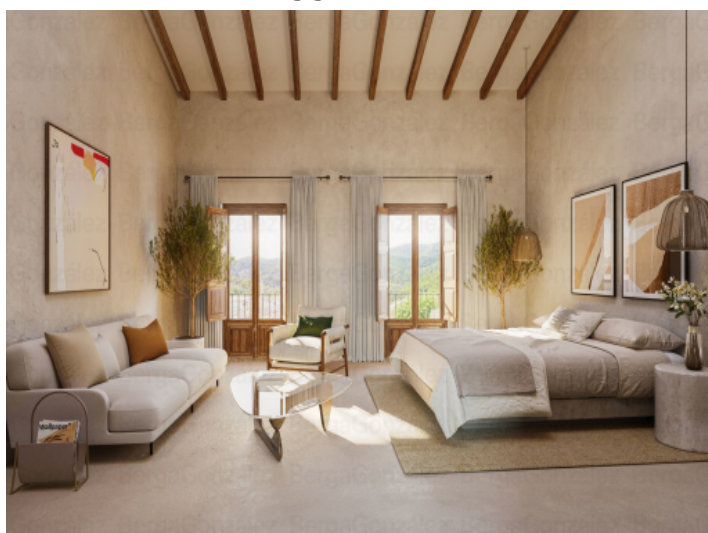
Schlafzimmer mit bodentiefen Fenstern