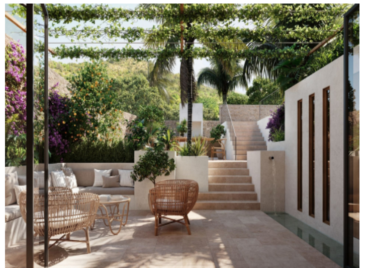
Schön angelegte Terrasse