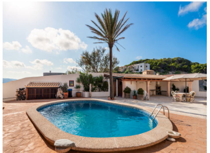
Der Poolbereich ist von einer Terrasse umgeben