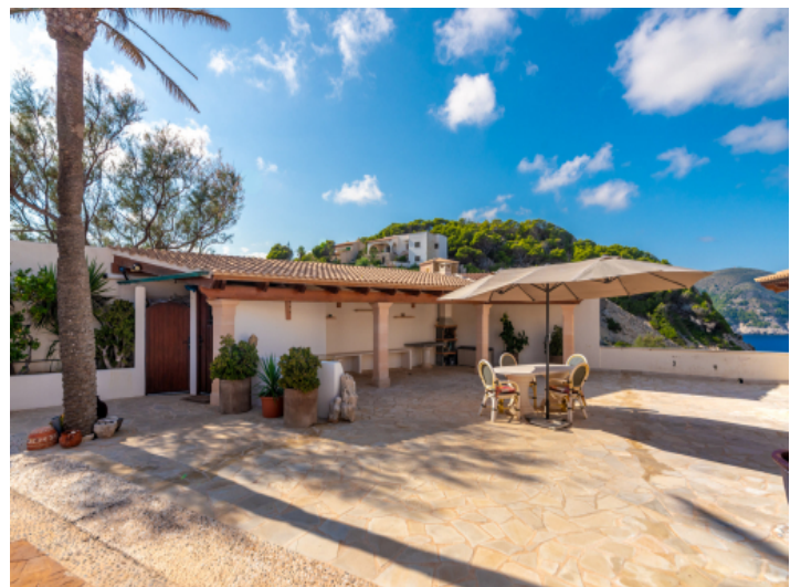
Terrasse mit Blick auf das Mittelmeer