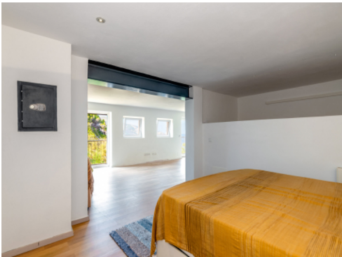
Apartment mit Schlafzimmer