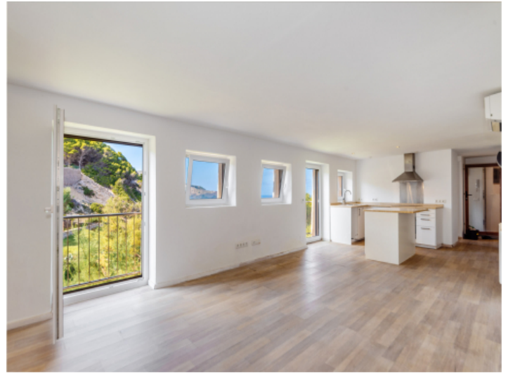
Apartment mit Küche