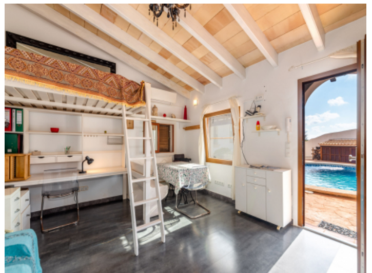
Studio mit Poolzugang