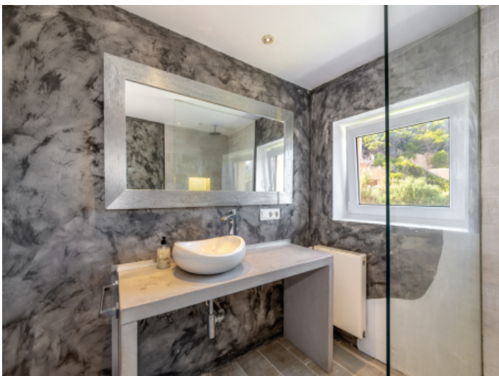
Badezimmer mit Tageslicht