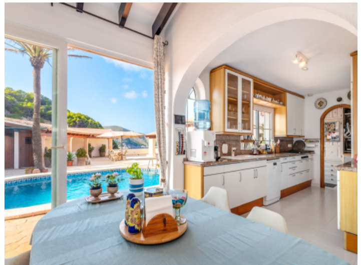
Voll ausgestattete Küche