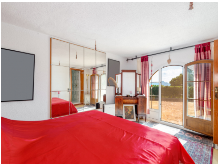
Schlafzimmer mit Terrassenzugang