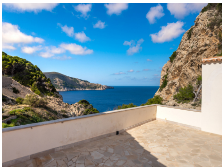
Meerblick von der Terrasse aus