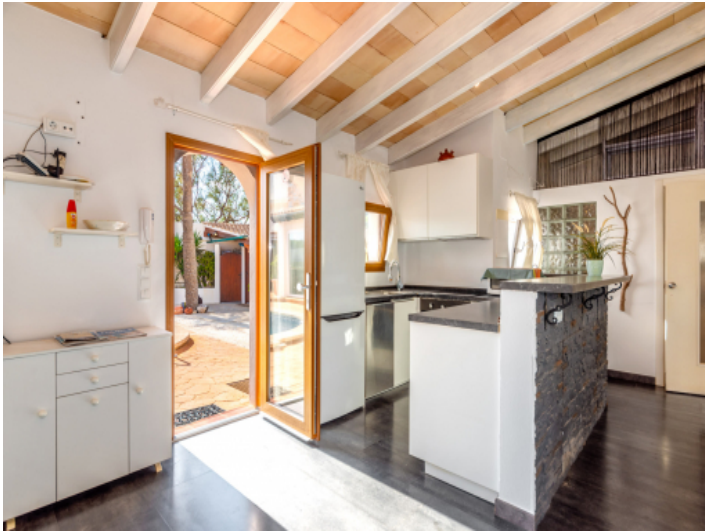
Küche 2 mit Bar