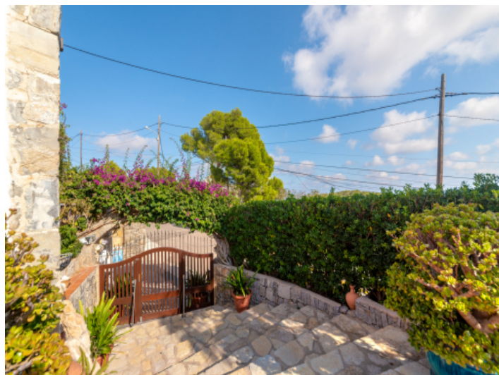
Eingang zur Villa