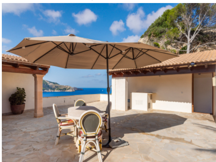
Terrasse mit Blick auf das Mittelmeer