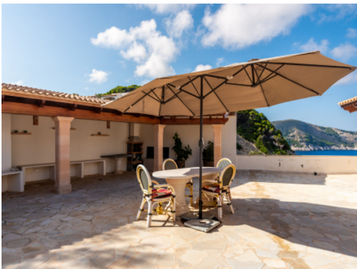
Terrasse mit Sommerküche