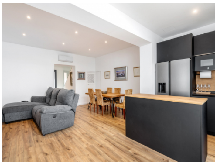
Offener Wohn-/Essbereich mit Küche