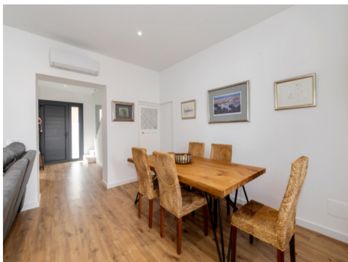
Elegant gestalteter Essbereich