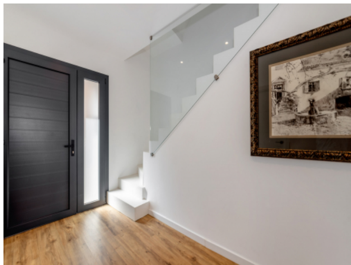
Modern gestalteter Eingangsbereich