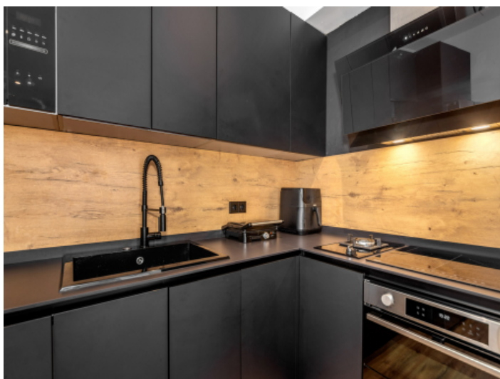
Moderne, komplett ausgestattete Küche