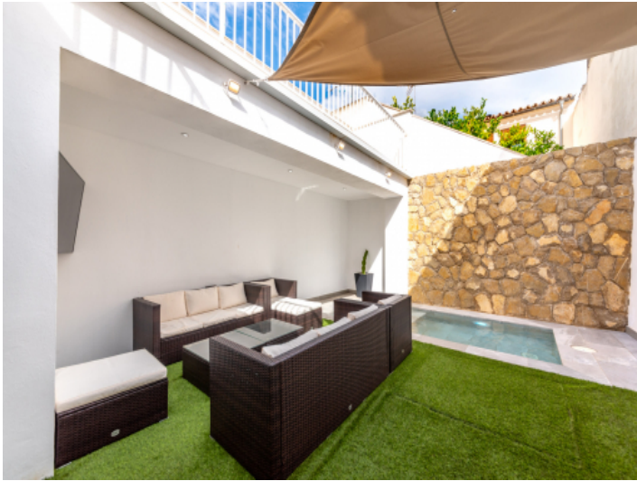
Innenhof mit Pool, Lounge und Privatsphäre