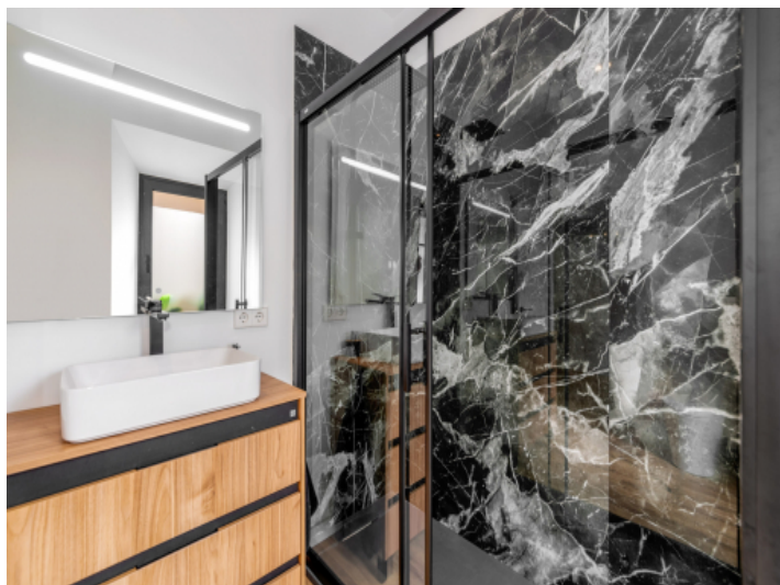
Eines von 3 Badezimmern