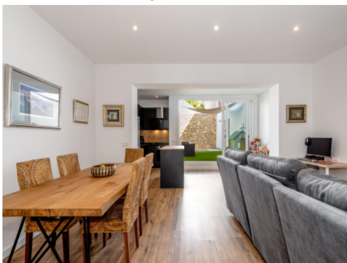
Heller und gemütlicher Wohn-/Essbereich