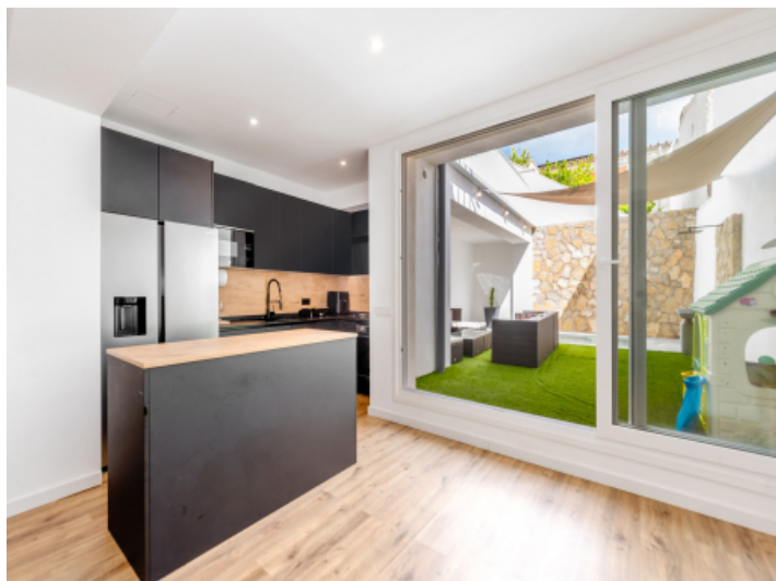
Küche mit Insel und Zugang zum Innenhof