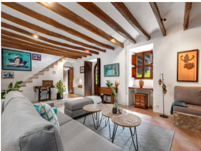
Wohnbereich und Eingang