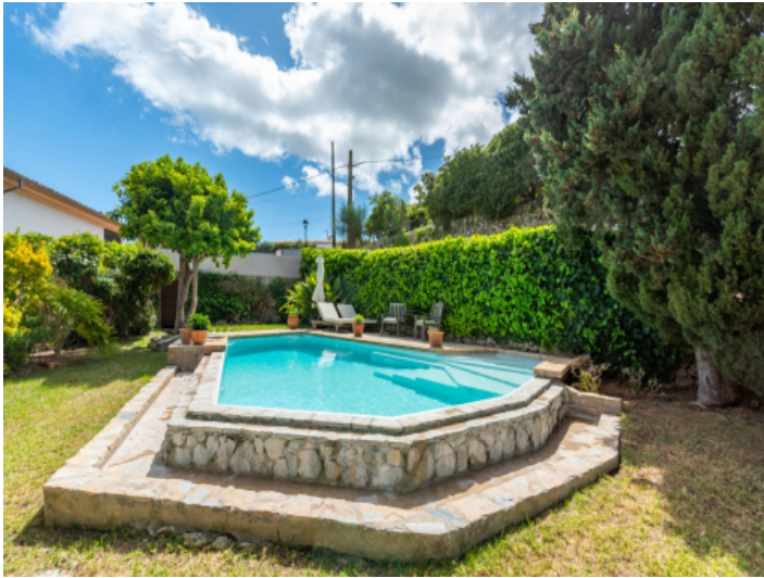
Swimmingpool ist in den Garten eingebettet