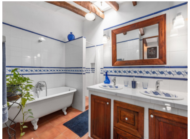
Badezimmer mit Badewanne