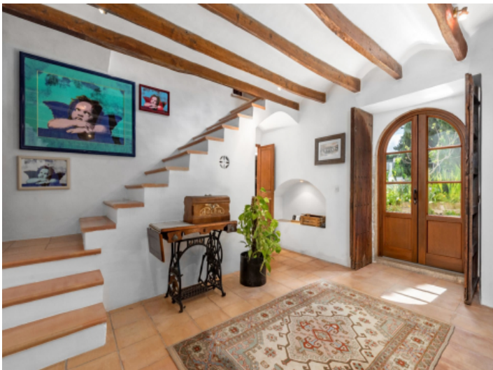
Eingangsbereich der Finca