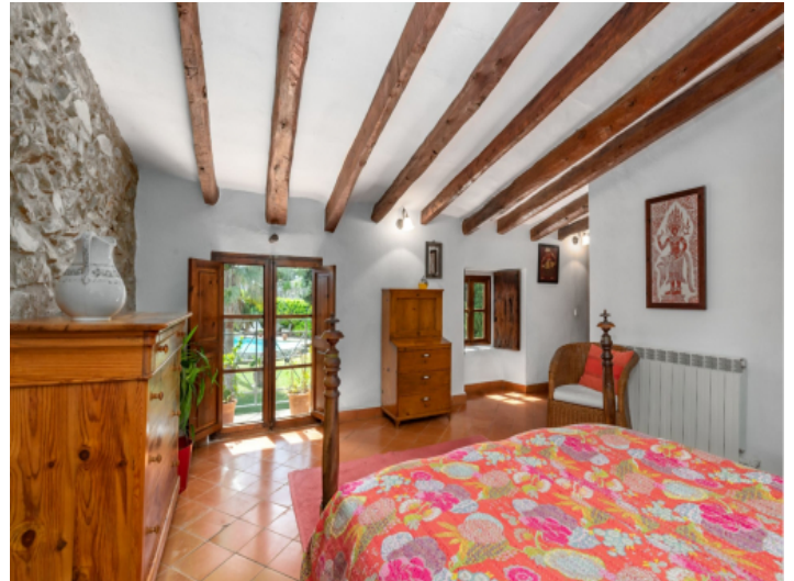
Schlafzimmer mit bodentiefen Fenstern