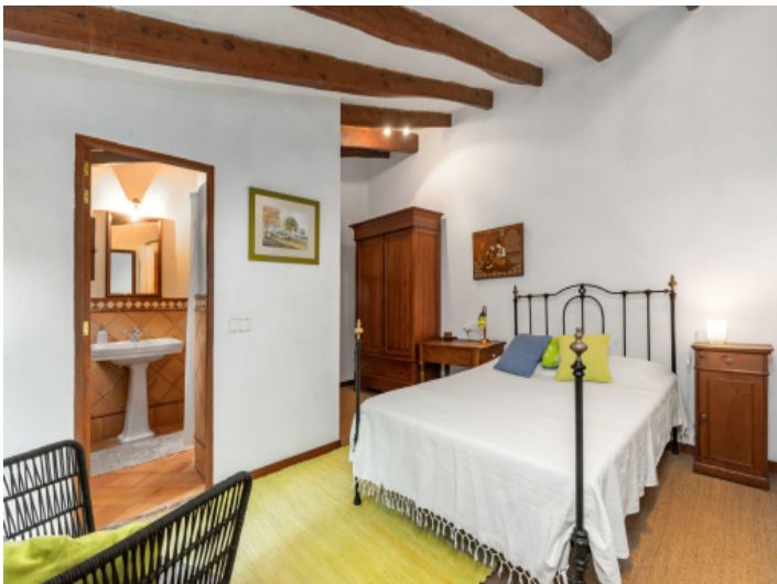
Schlafzimmer mit Badezimmer en Suite