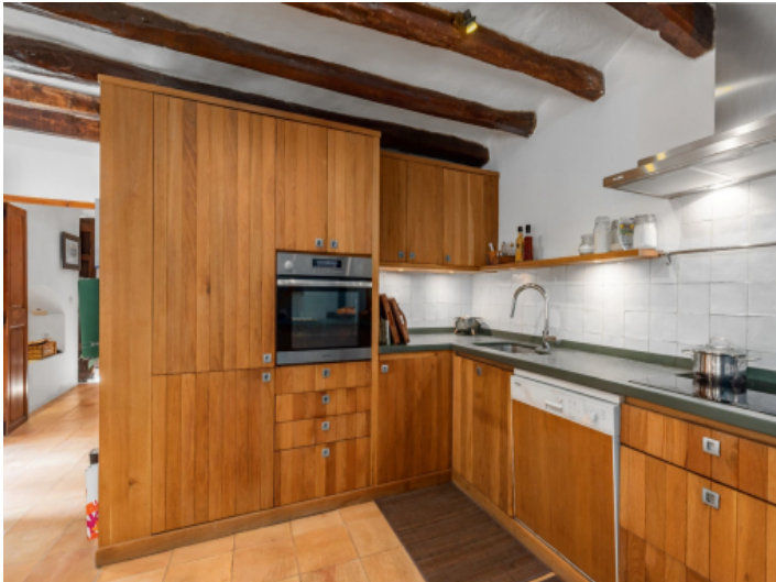
Voll ausgestattete Küche