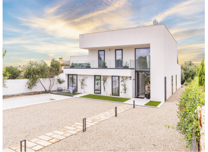
Außenansicht und Eingang