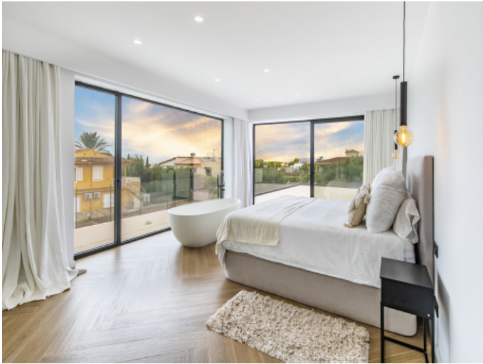
Doppelschlafzimmer mit Ausblick