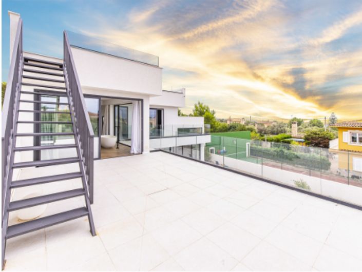
Mehrere , große Dachterrassen