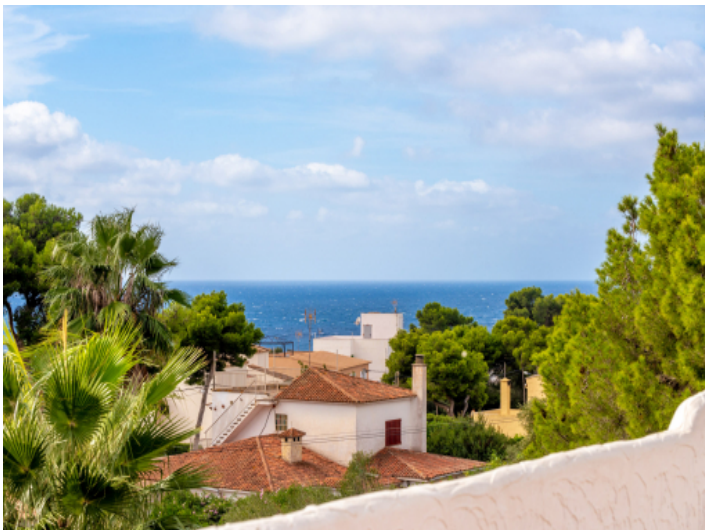
Wunderschöner Ausblick aufs Meer