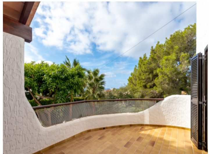
Sonnenterrasse mit Weitblick