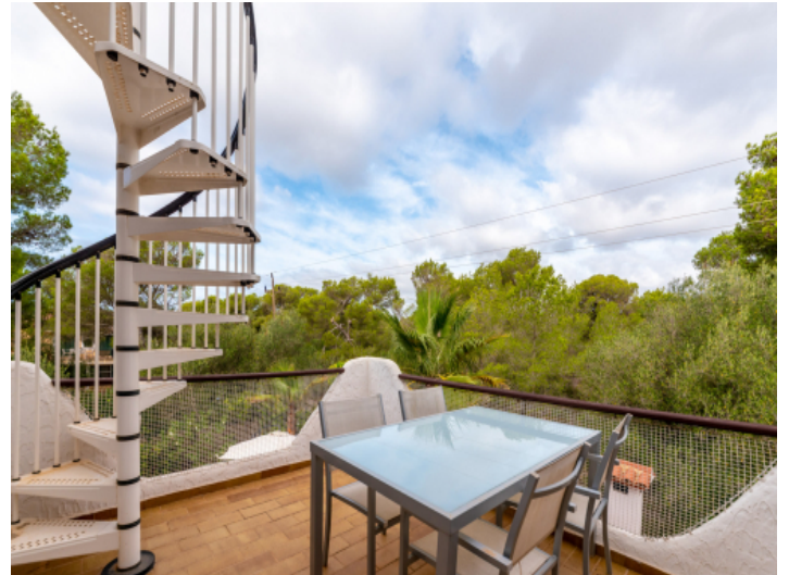
Zugang zur Terrasse