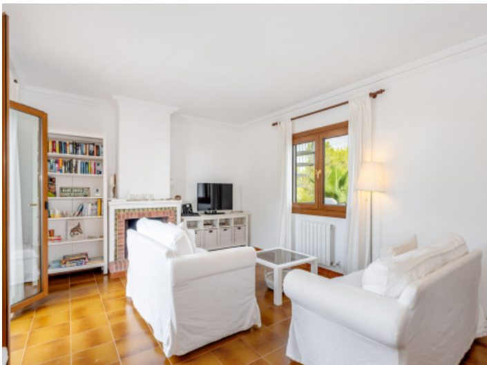
Gemütlicher Wohnbereich im Obergeschoss