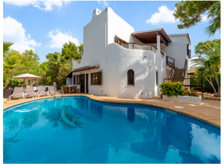
Villa und Pool