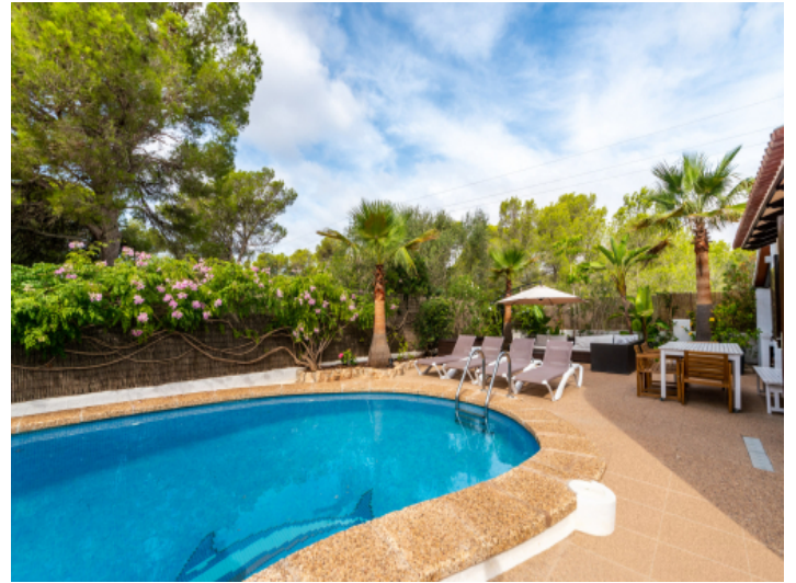
Poolbereich mit viel Privatsphäre