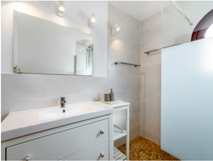
Eines von 2 Badezimmern