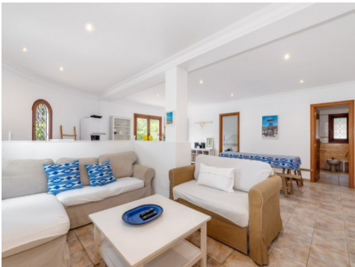
Großer Wohnbereich im Erdgeschoss