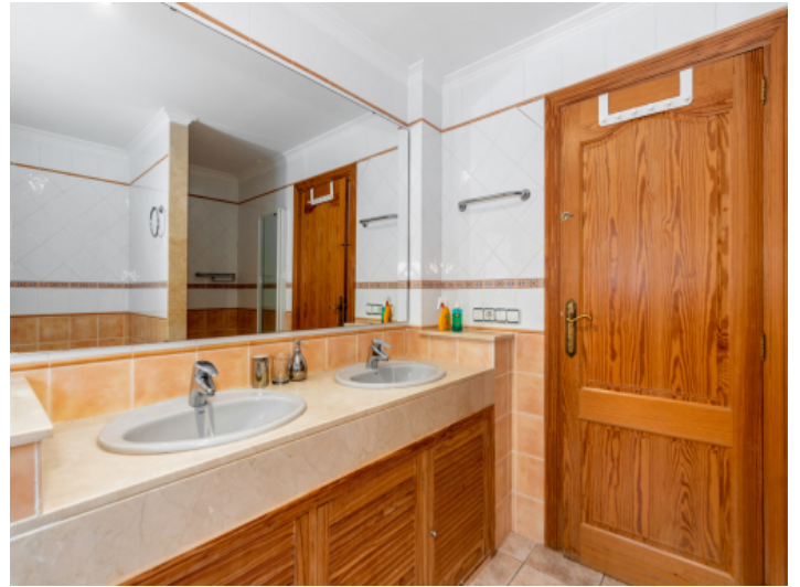
Eines von 2 Badezimmern