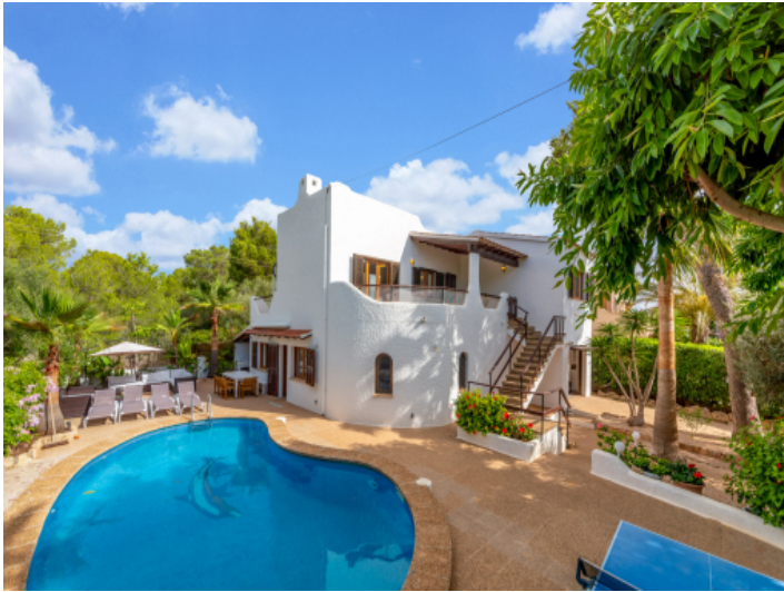
Schöner mediterraner Außenbereich