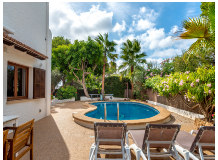
Poolbereich mit Palmengarten