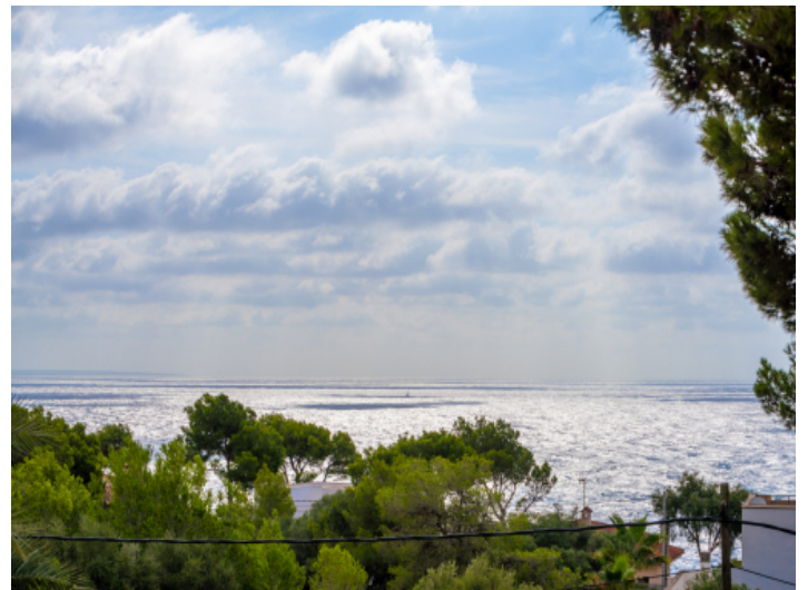
Fantastischer Blick aufs Meer