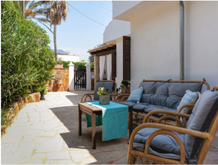
Terrasse mit gemütlichem Sitzbereich