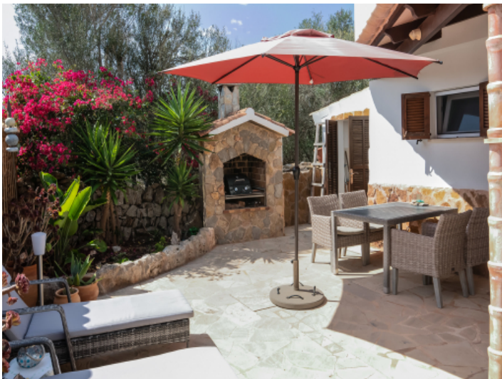
Grillbereich mit Sitzgelegenheit