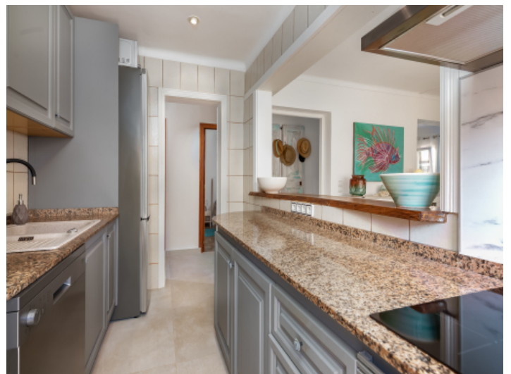
Komplett ausgestattete Küche