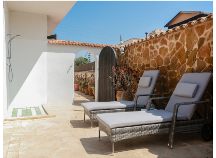
Sonnterrasse mit Außendusche