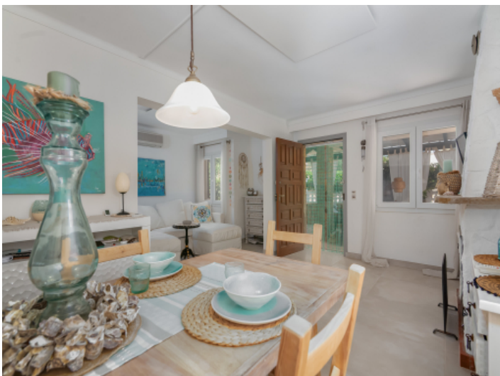
Essbereich mit Kamin