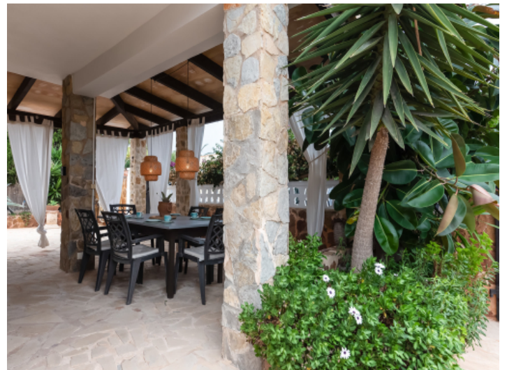
Überdachte Terrasse mit Essbereich