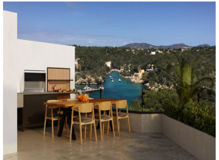
Bbq Dachterrasse mit Meerblick