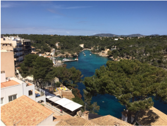
Lage des Hauses