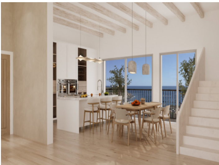
Küche mit Meerblick