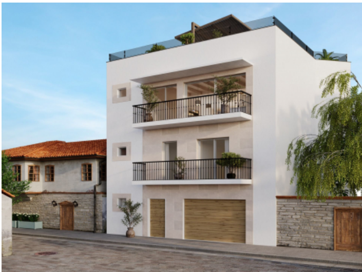
Außenansicht des Hauses