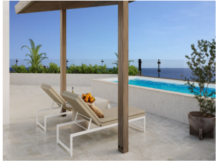
Fantastische Terrasse mit Pool