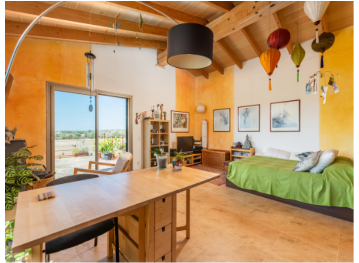
Helles, separates Gästepartment