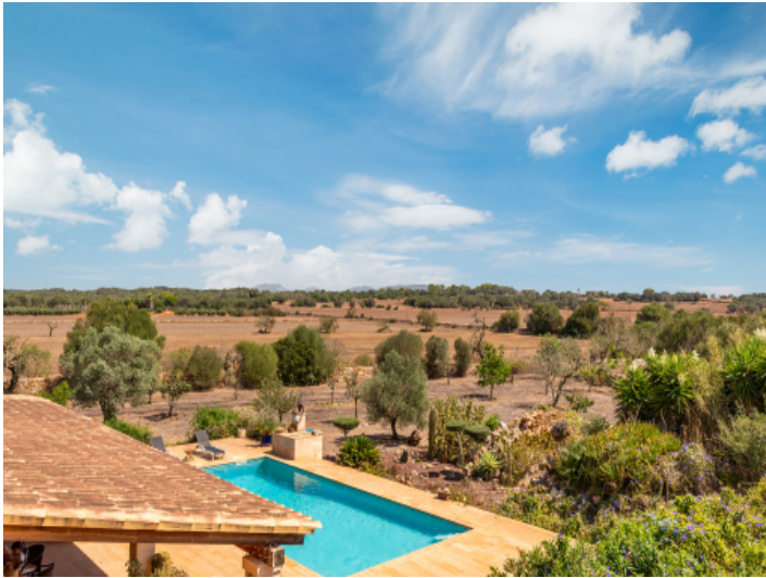
Einzigartiger Landschaftsblick vom Balkon