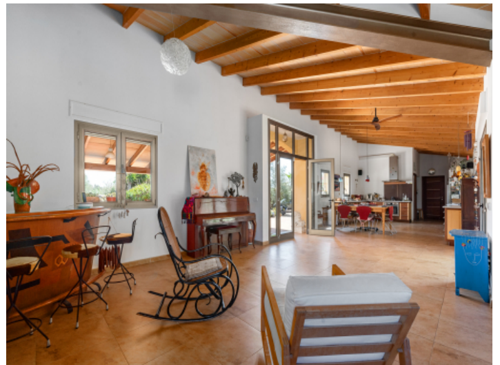
Offener Wohn-und Eingangsbereich