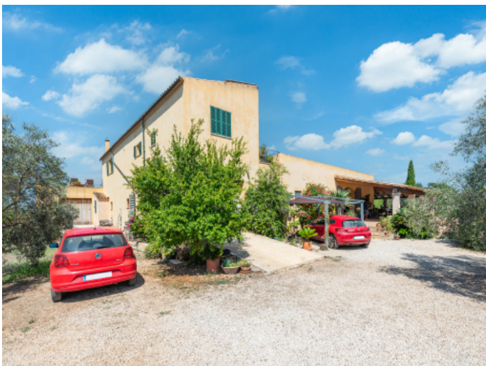
Zufahrt zum Haus