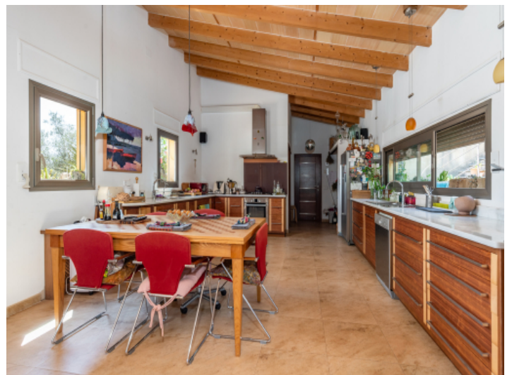
Küche mit Essbereich