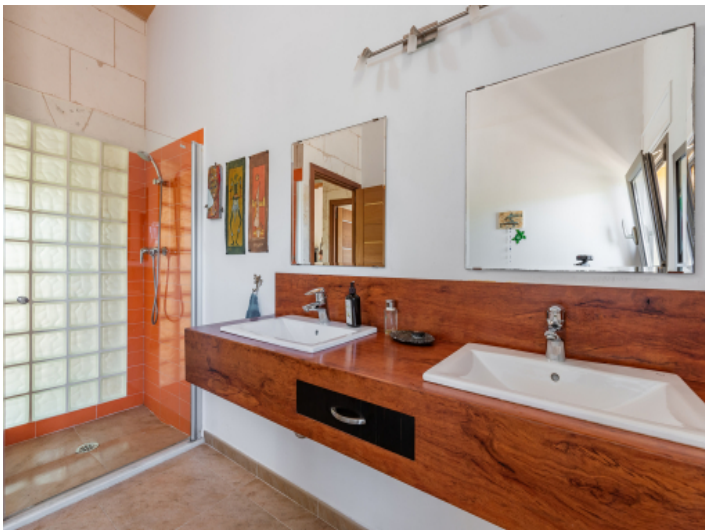
Badezimmer mit Dusche