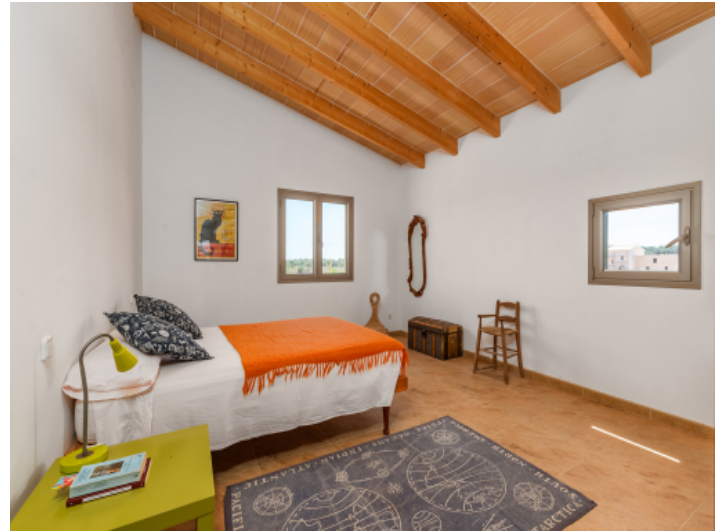
Eines von 3 Schlafzimmern