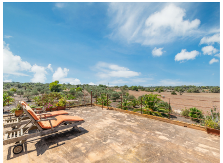
Weitblick über die Landschaft