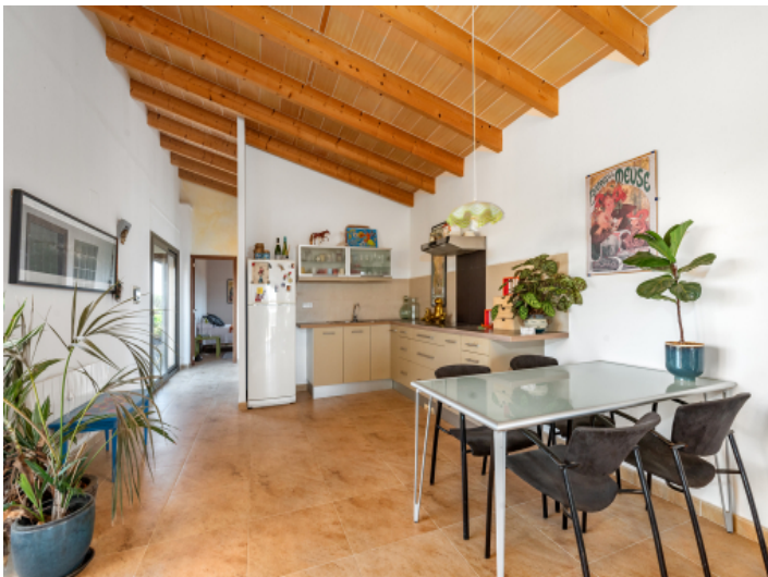
Küche mit Essbereich und Blick zum Schlafzimmer