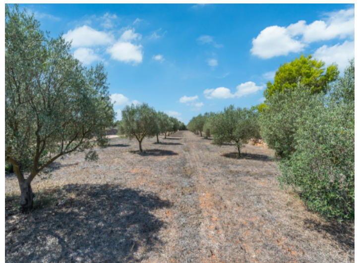
Feld mit Olivenbäumen