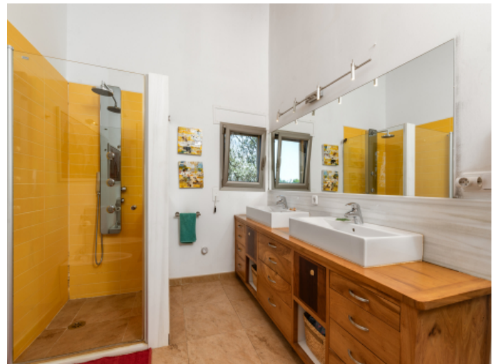
Eines von 4 Badezimmern