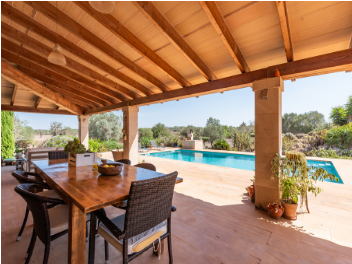
Überdachte Terrasse mit Essbereich