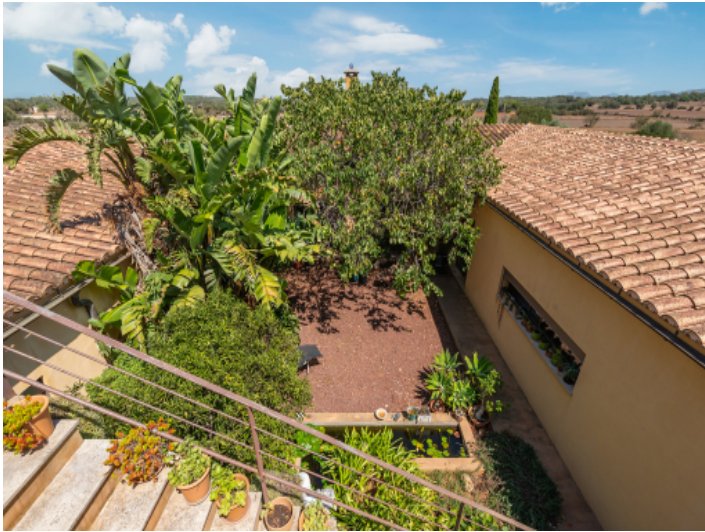
Zugang zum Gästepartment