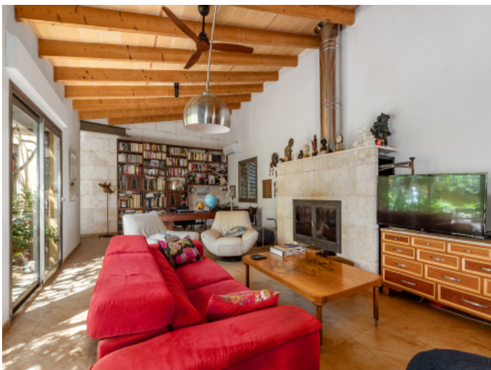
Wohnbereich mit Kamin