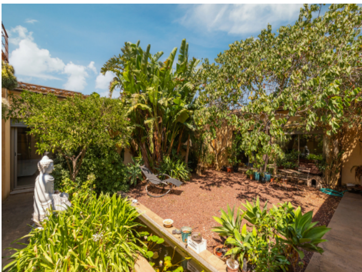
Bepflanzter Patio im Zentrum des Hauses