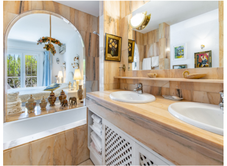
Helles Badezimmer mit Badewanne