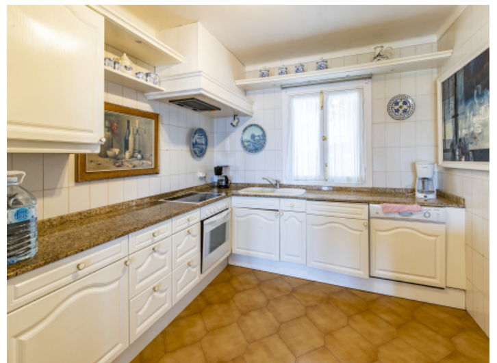
Voll ausgestattete Küche