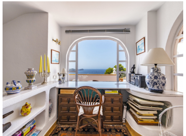
Büro mit Meerblick