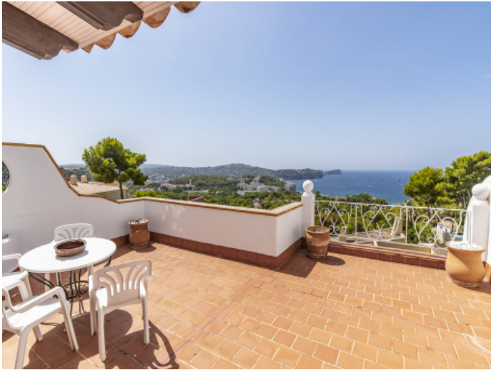
Terrasse mit Meerblick