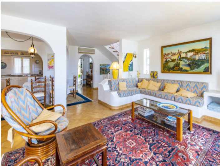
Wohnbereich mit Blick zum Flur