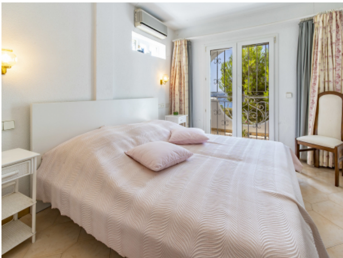
Schlafzimmer mit bodentiefen Fenstern