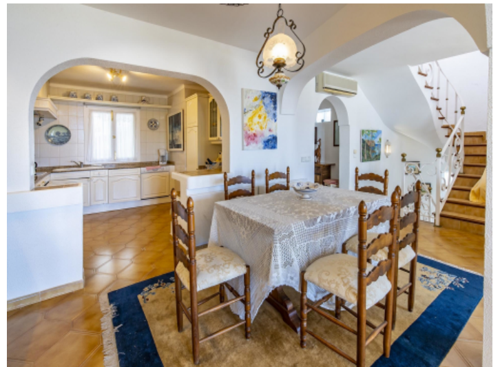
Blick vom Essbereich in die Küche