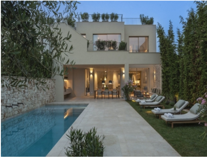
Haus am Abend