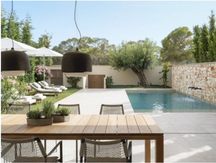
Pool und Terrasse