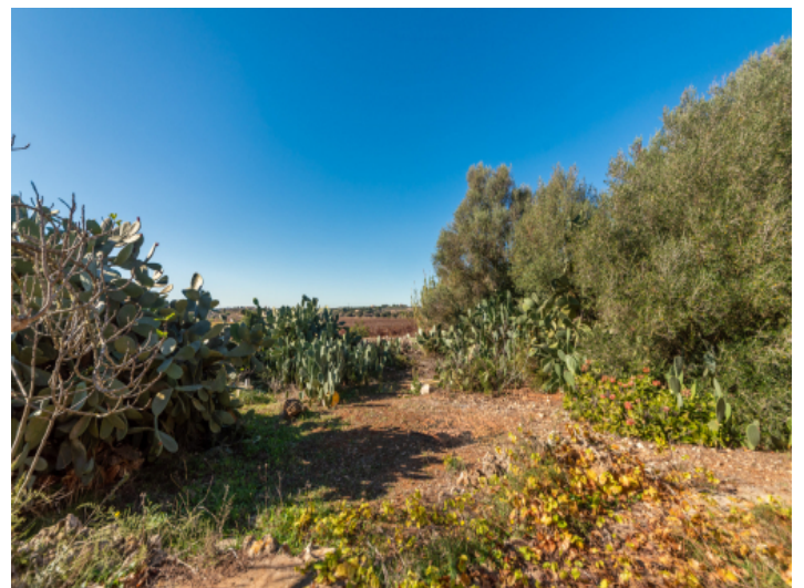
Finca in Santa Margalida