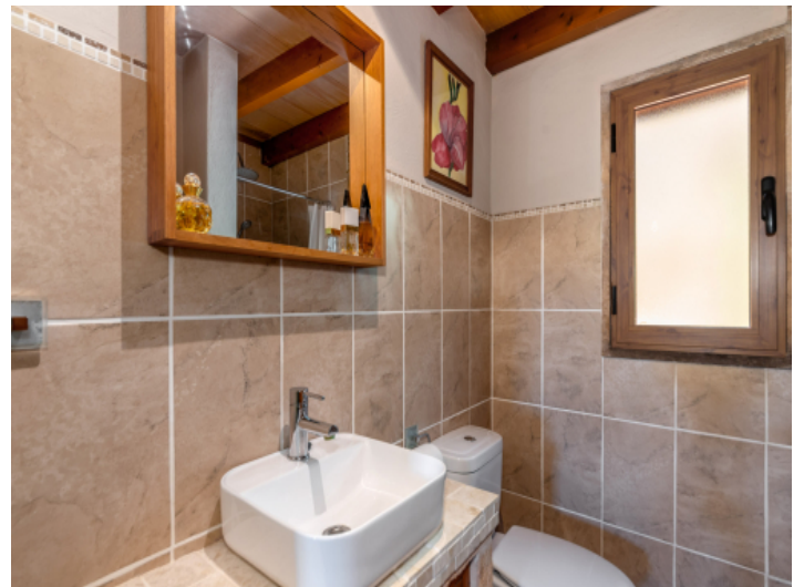
Badezimmer mit Tageslicht