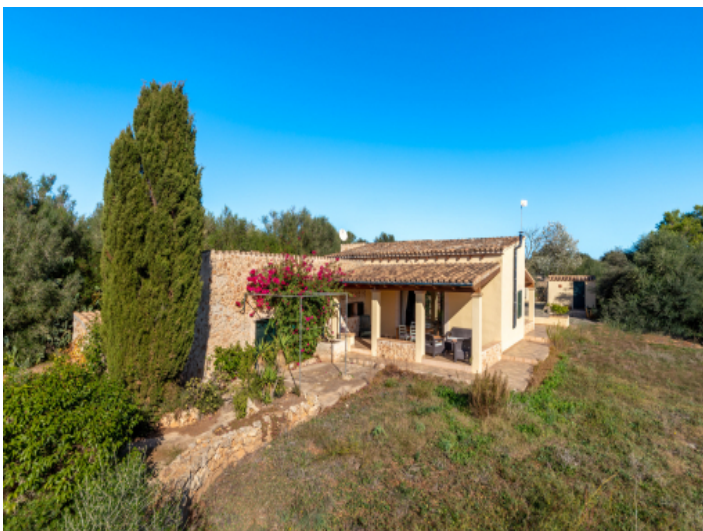
Blick vom Garten zur Finca