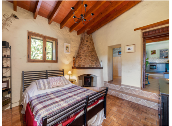
Schlafzimmer mit Kamin