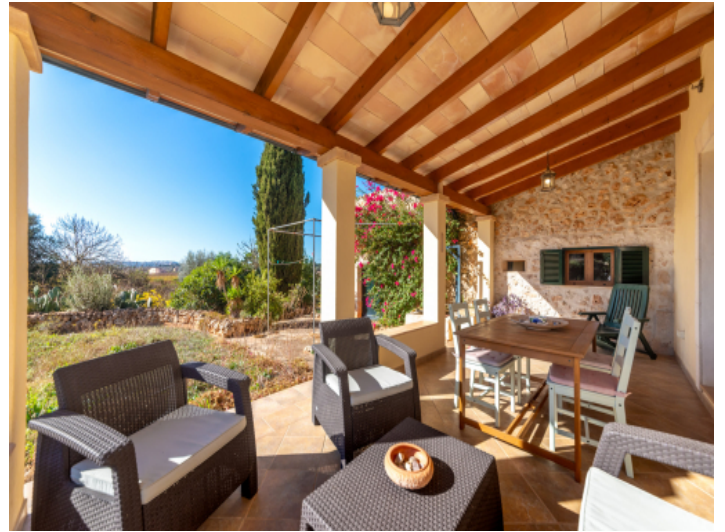
Überdachte Terrasse mit Loungebereich