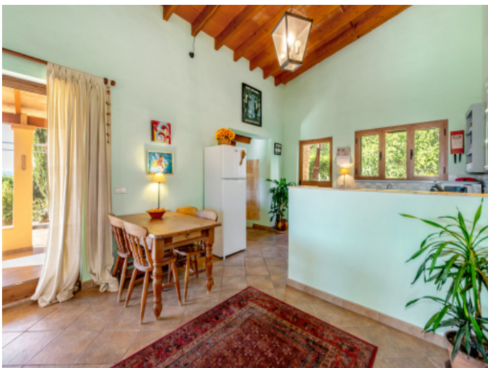
Offene Küche und Essbereich