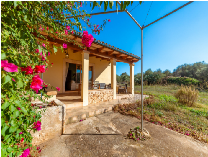
Blick vom Garten zur Finca