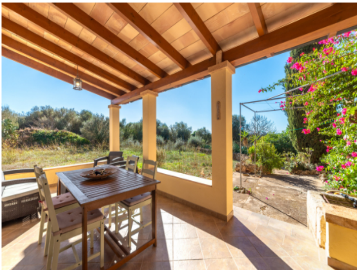
Blick in den Garten von der Terrasse