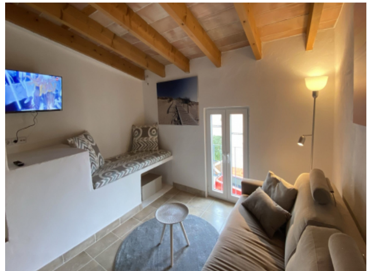
Gemütliches Zimmer mit Kamin im Obergeschoss