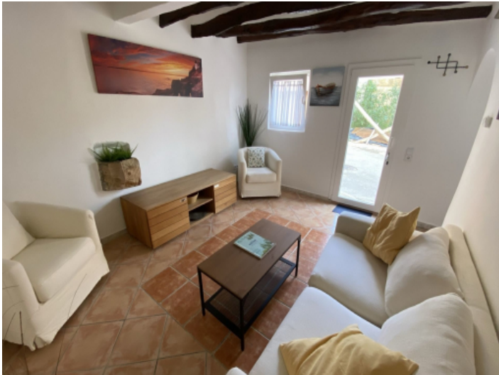
Wohnbereich im Erdgeschoss