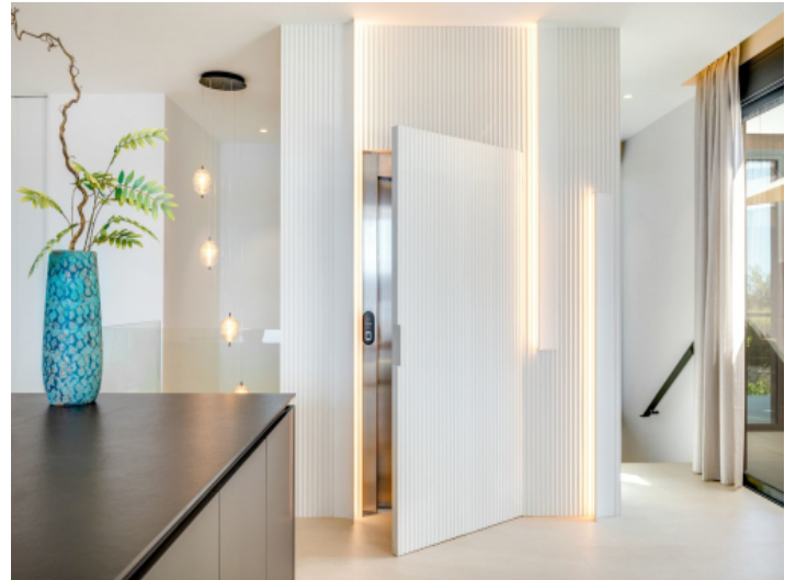
Ein Aufzug verbindet die Stockwerke