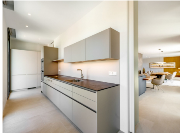
Weitere versteckte Küche