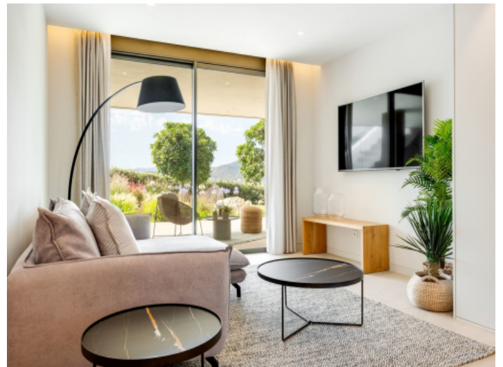
Wohnbereich im untrgeschoos