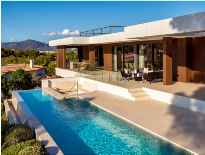
Eleganter Pool mit Sonnenterrasse