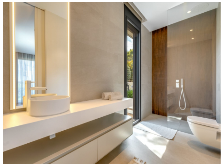
Eines von 4 Badezimmern