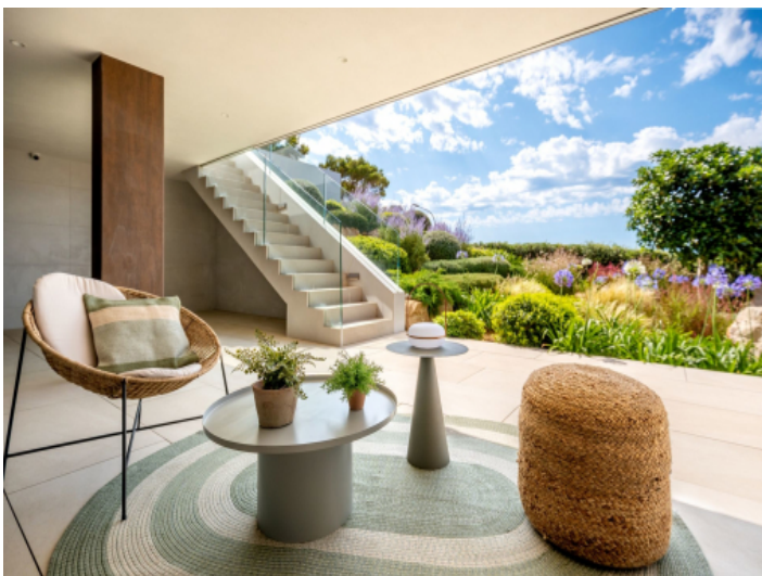
Entspannter Loungebereich auf der unteren Terrasse