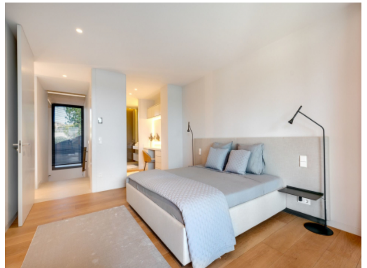
Offenes en Suite Badezimmer