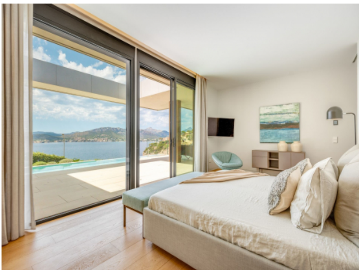
Schlafzimmer mit Meerblick-Terrasse