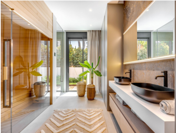
Luxusbadezimmer mit Dusche