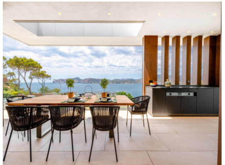
Essbereich im Freien mit Meerblick