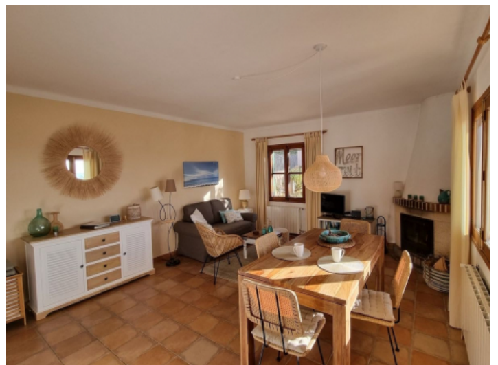
Wohn-/Essbereich mit Kamin