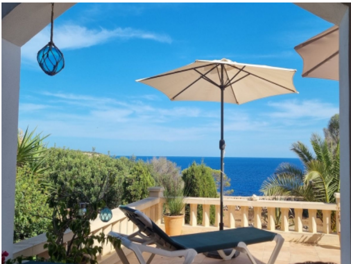
Sonnterrasse mit Weitblick