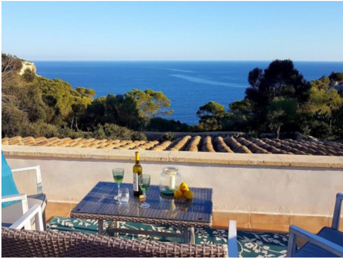
Dachterrasse mit beeindruckendem Meerblick