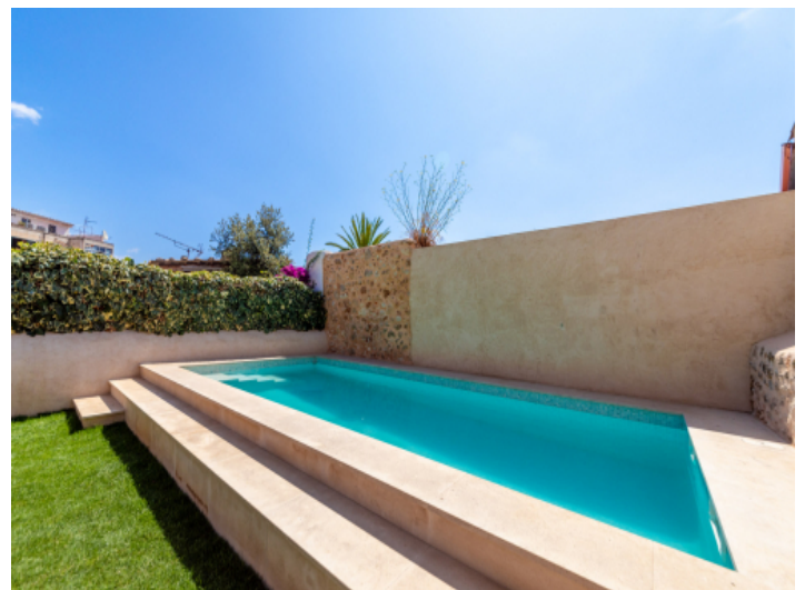
Der Poolbereich lädt zum Entspannen ein