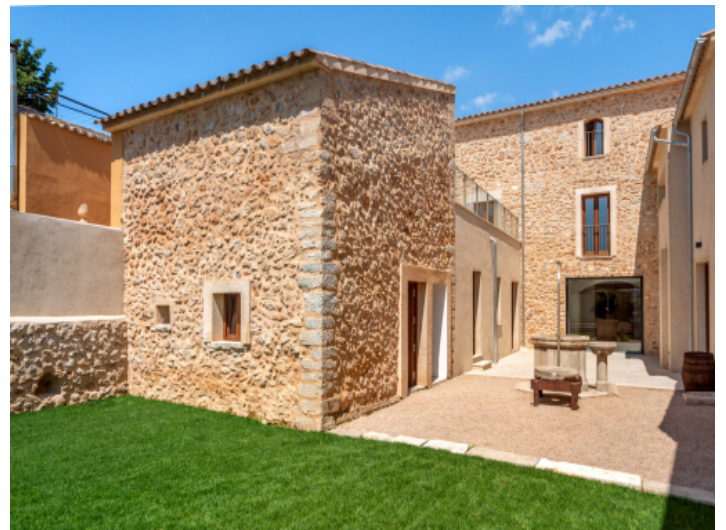
Ansicht des Hauses