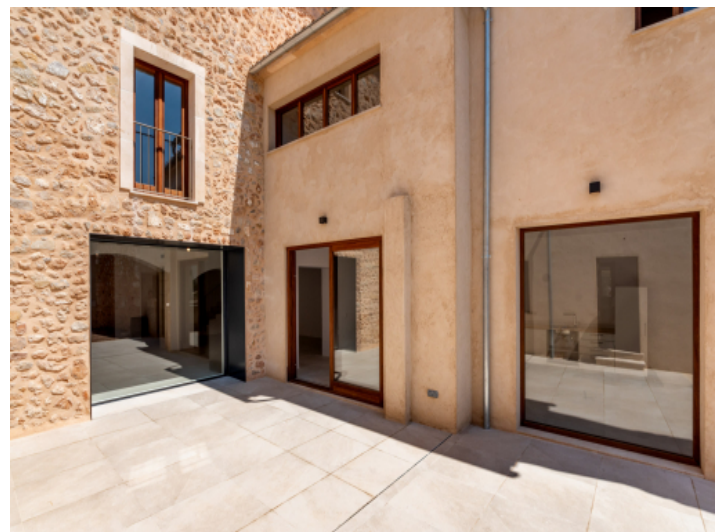
Großer sonniger Patio