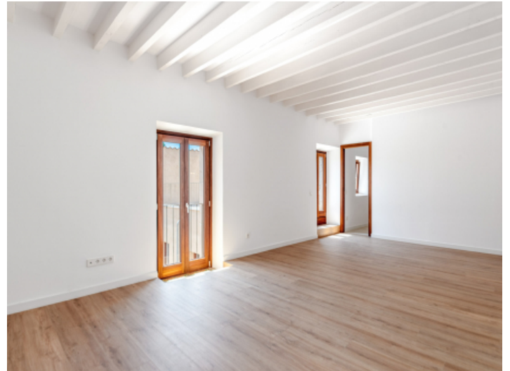
Eines von 5 Schlafzimmern