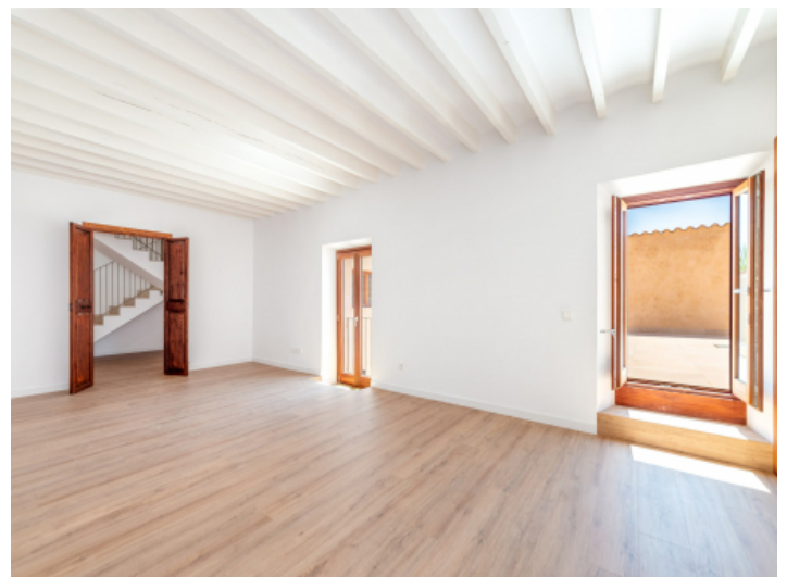
Zugang zur Terrasse im Obergeschoss