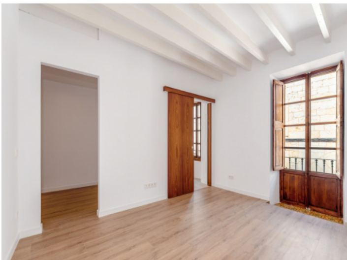
Eines von 5 Schlafzimmern