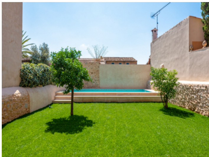
Schöner Garten mit Pool