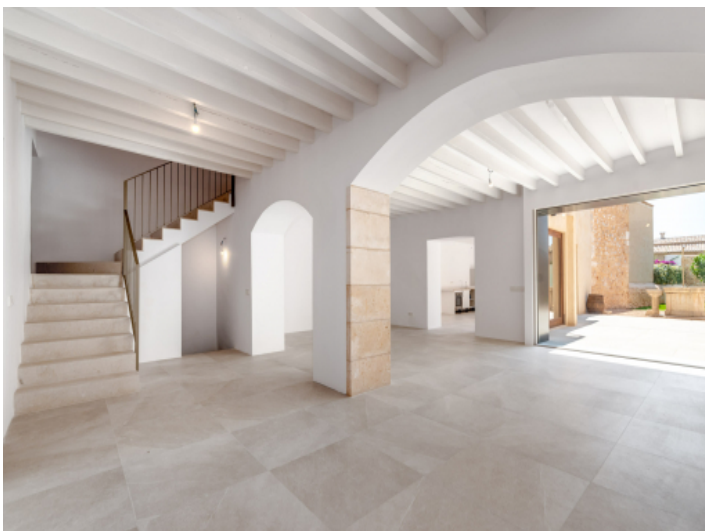
Wohnbereich mit Gartenzugang