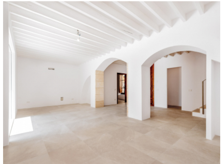
Wohnbereich mit Steinbögen