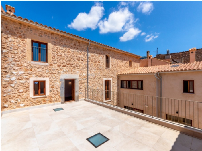
Sonnige obere Terrasse