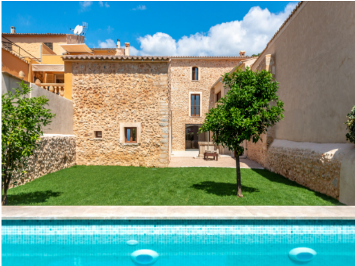
Stadthaus mit Pool