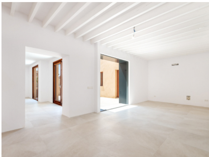
Offener Wohnbereich mit patiozugang