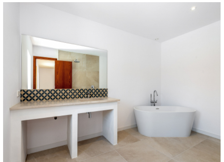
Eines von 6 Badezimmern