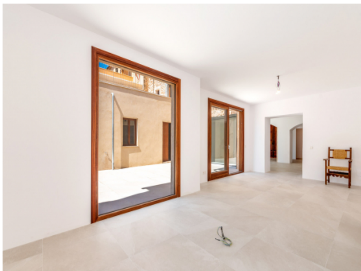
Patiozugang von einem anderem Raum