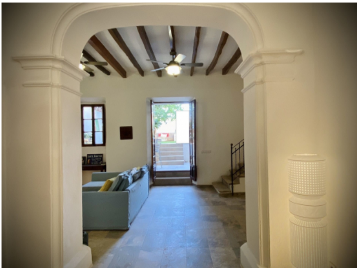
Wohnbereich mit Gartenzugang