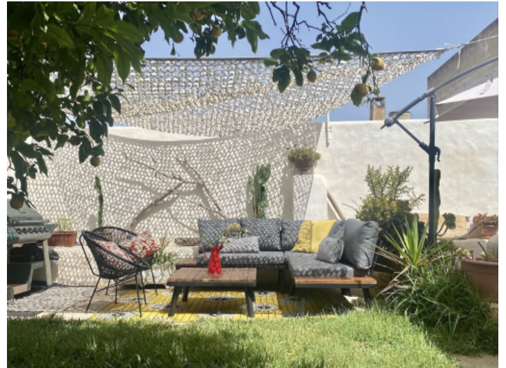
Idyllischer Loungebereich im Garten