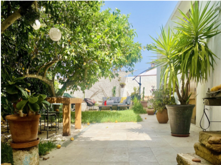
Schön bepflanztter Garten