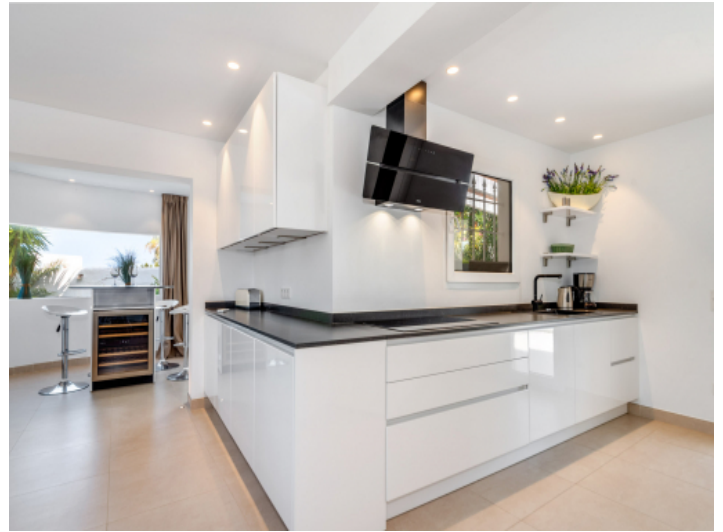
Moderne Küche in weiß