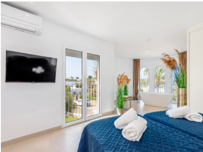
Hauptschlafzimmersuite mit freistehender Badewanne