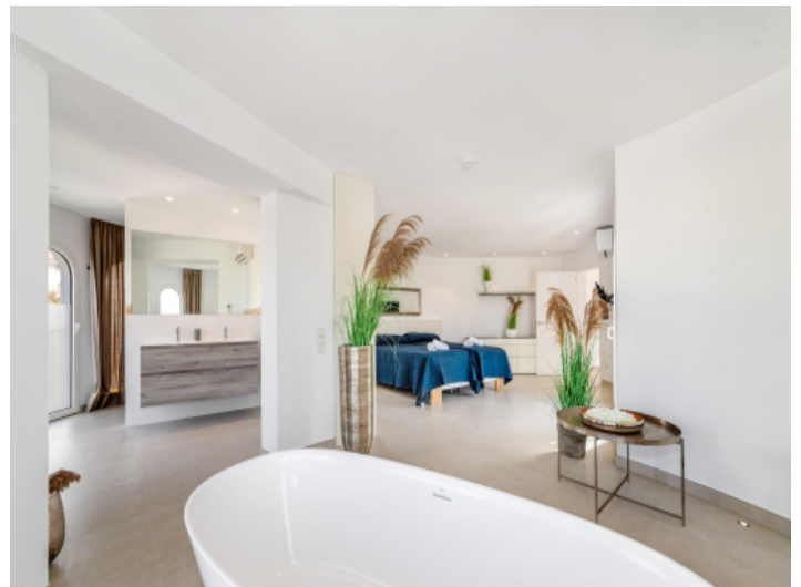
Blick aus dem Badezimmer