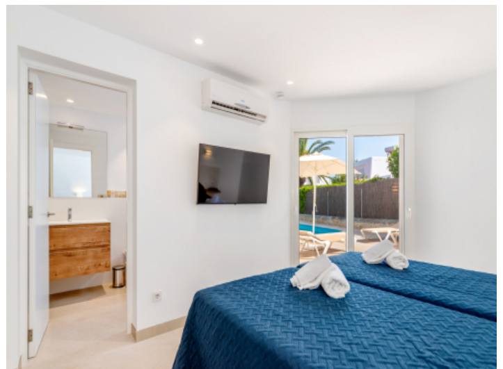
Schlafzimmer mit Badezimmer en Suite