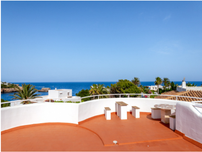
Meerblick von der Dachterrasse