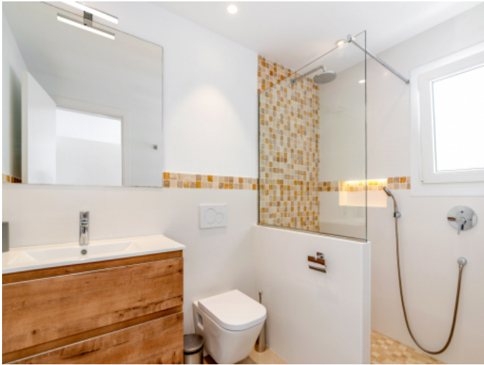
Elegantes Badezimmer en Suite