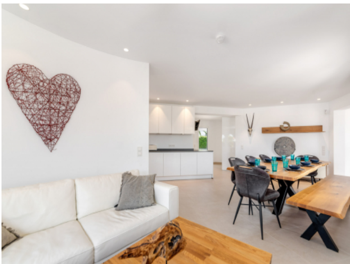
Offener Wohn- und Essbereich