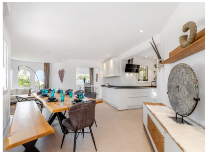
Offener Wohn- und Essbereich