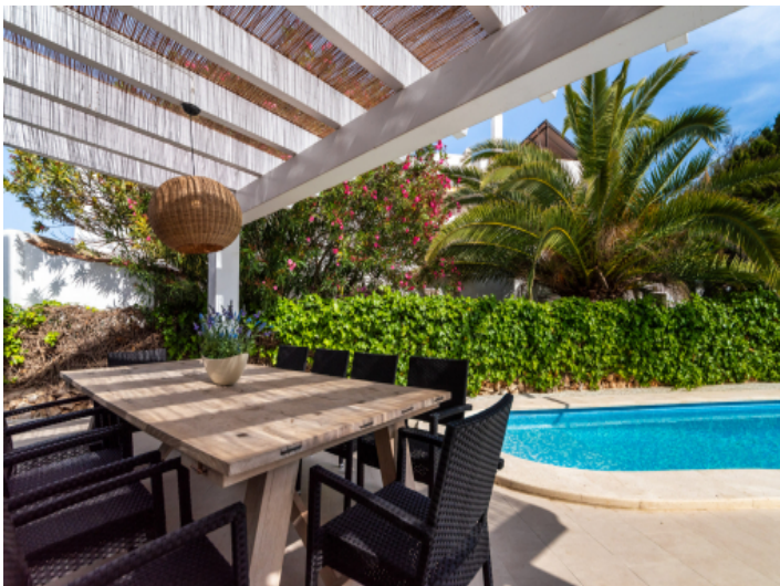
Überdachte Terrasse am Pool