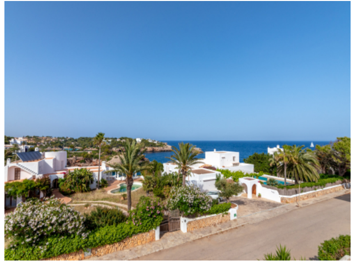
Meerblick von der Dachterrasse