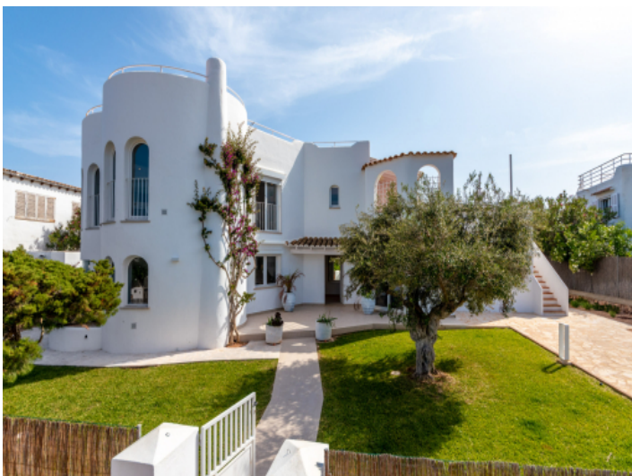
Außenansicht und Garten der Finca