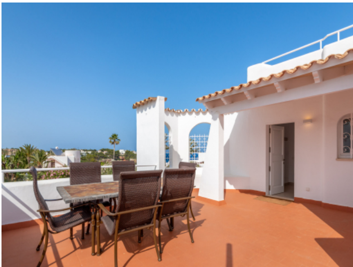
Dachterrasse mit Sitzbereich