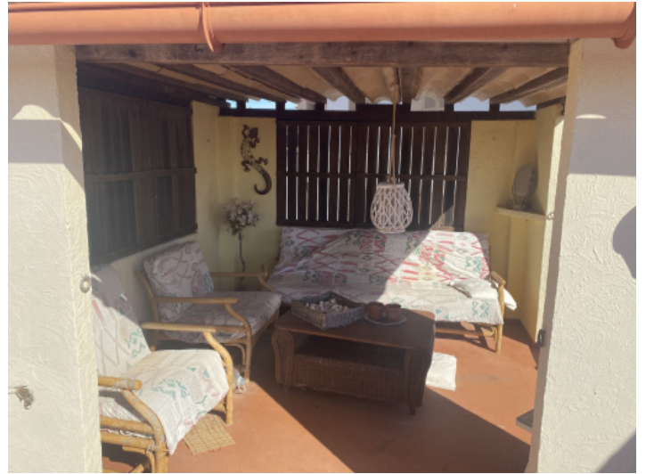
Überdachte Chill Out Lounge