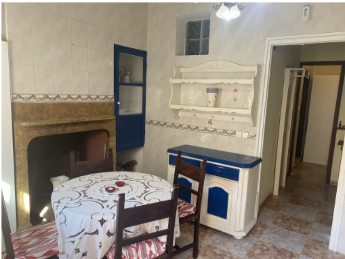
Essbereich und Küche