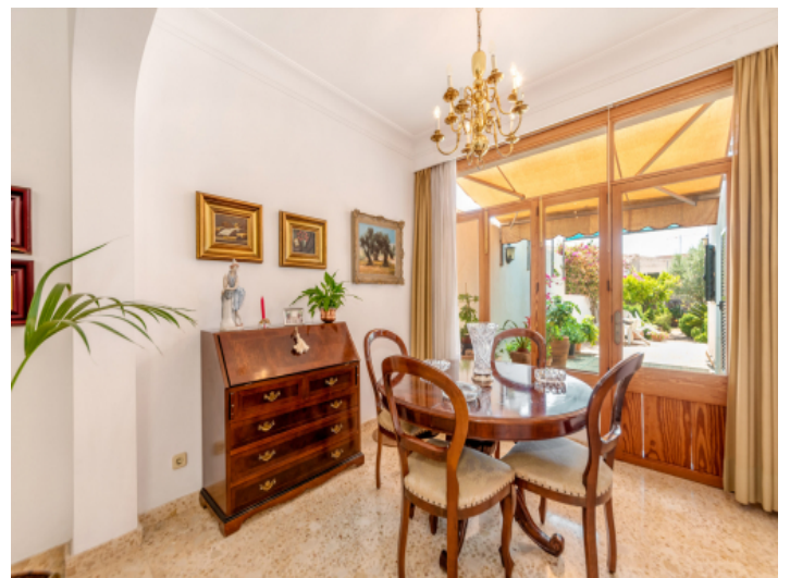
Essbereich mit Terrassenzugang