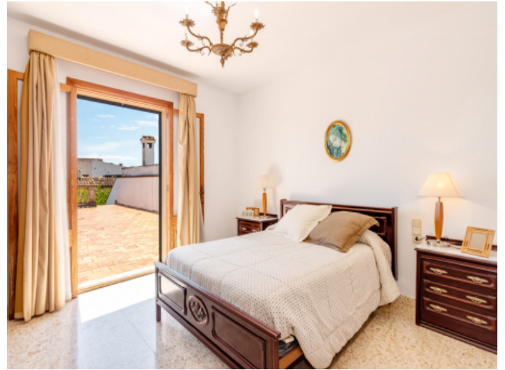
Schlafzimmer mit Dachterrasse