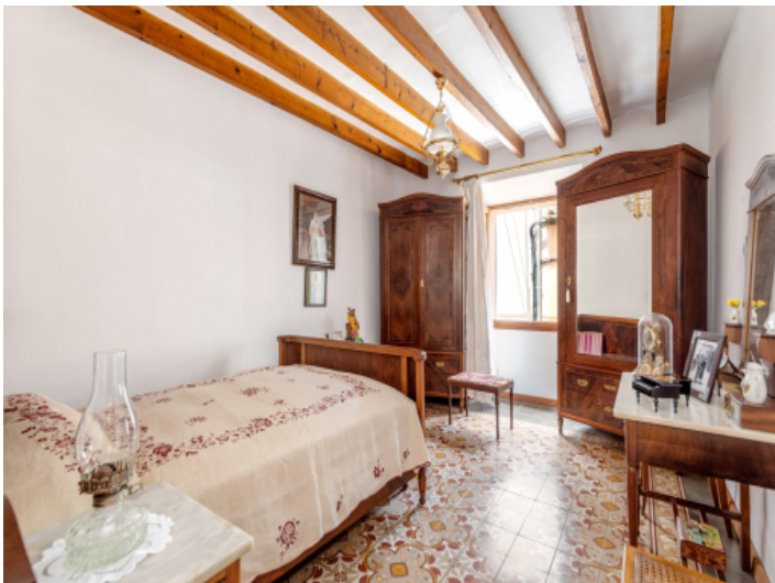
Schlafzimmer mit Dachterrasse