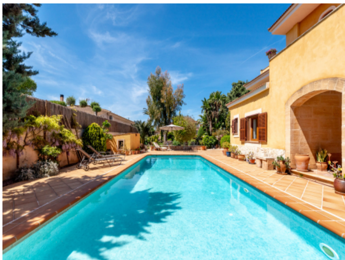
Poolbereich und Garten