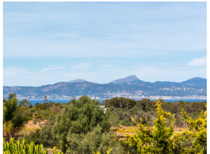
Weitblick zum Meer