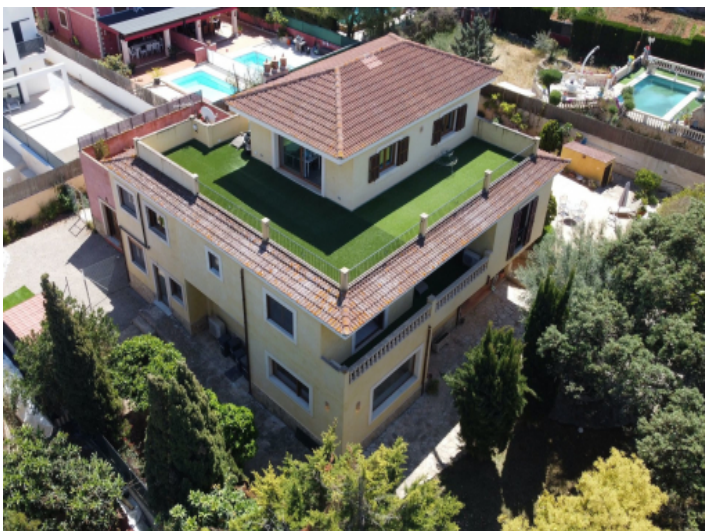
Außenansicht der Stadtvilla