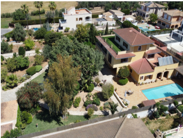
Stadtvilla mit Pool in Lluçmajor, Las Palmeras