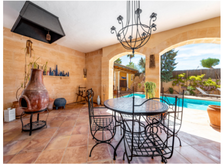
Überdachter Essbereich auf der Terrasse