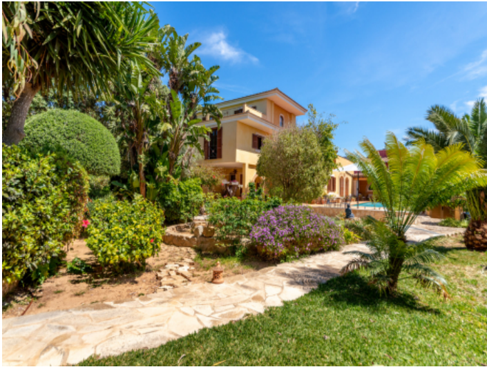
Außenbereich und Garten des Stadthauses