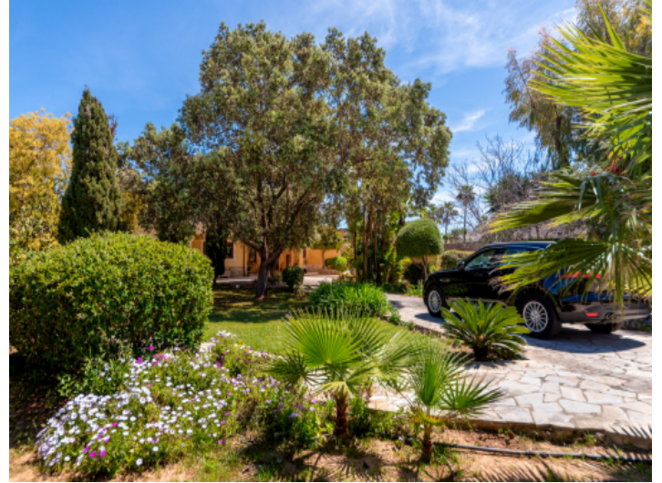
Außenbereich und Garten des Stadthauses