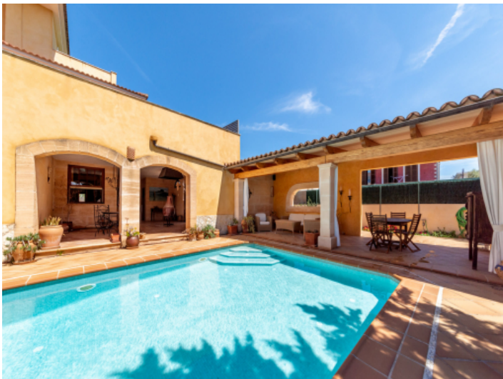
Einladender Pool und Terrasse