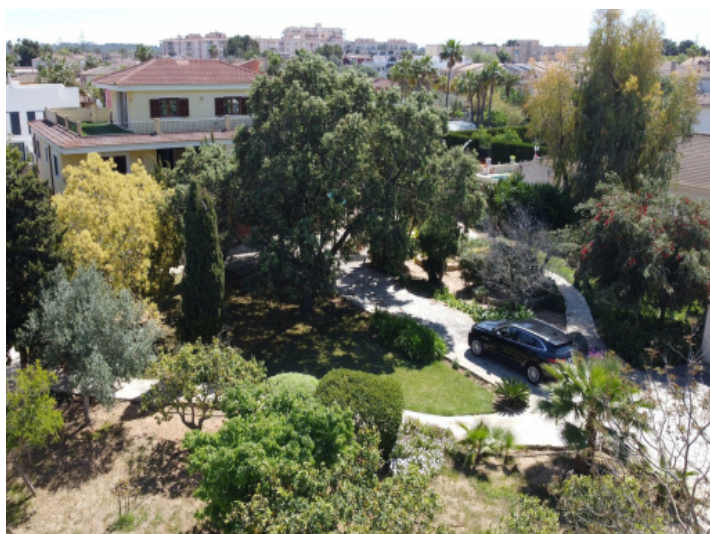
Grundstück und Garten