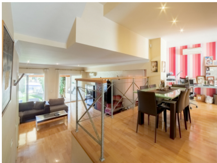
Esszimmer mit Arbeitsbereich