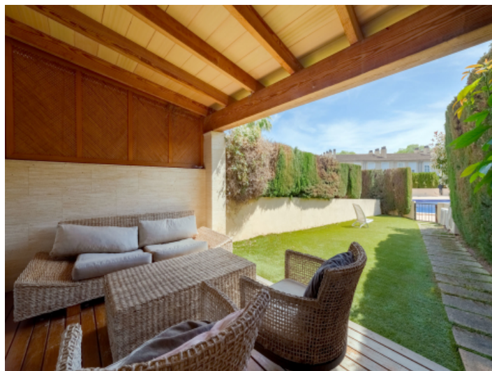
Überdachte Terrasse mit Garten