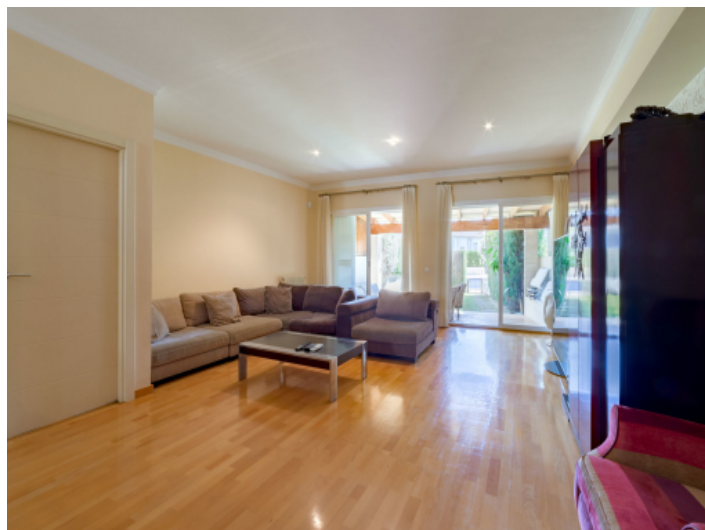
Wohnzimmer mit Terrassenzugang