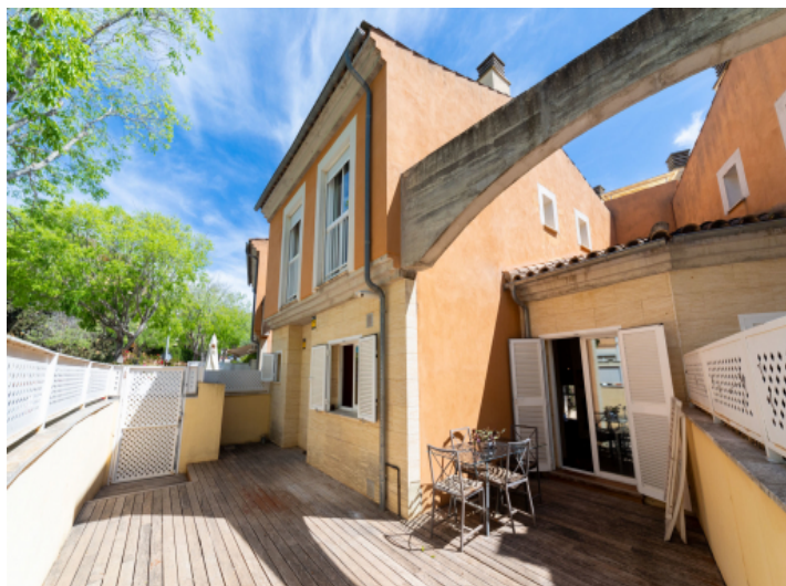
Sonnenterrasse mit Sitzgelegenheit