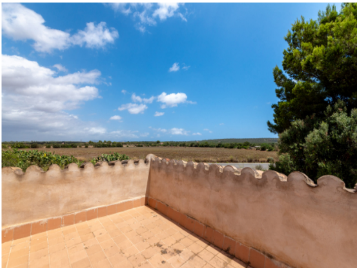
Beeindruckender Landschaftsblick von der Dachterrasse aus