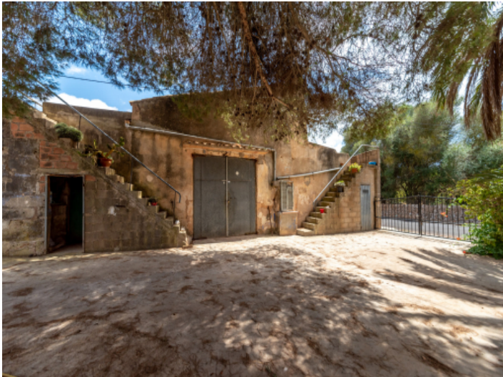
Zufahrt zum Grundstück