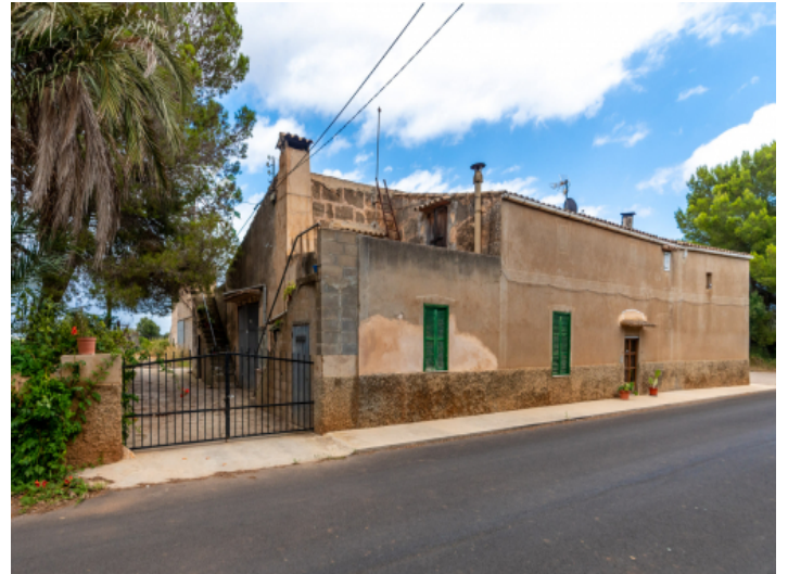
Blick von der Strasse zur Finca