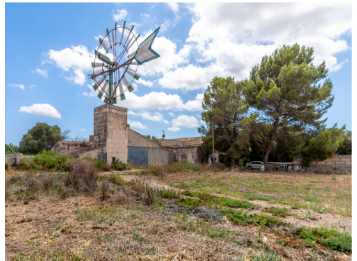
Grosszügiges Grundstück mit einer Windmühle