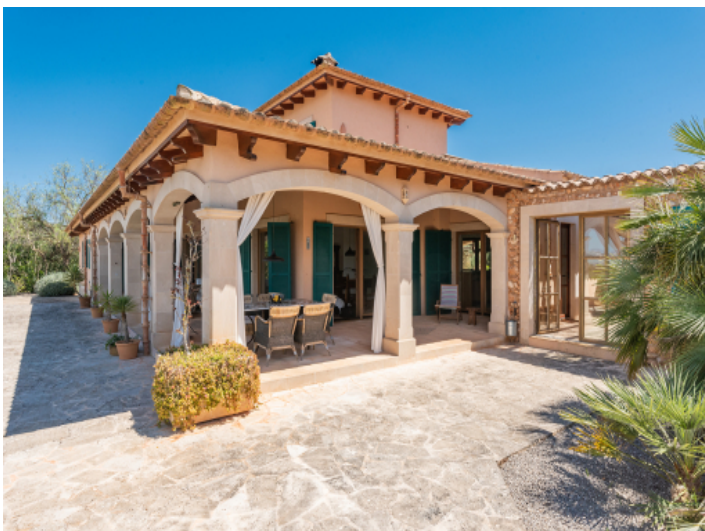
Ansicht der Terrassen und Eingang zum Haus