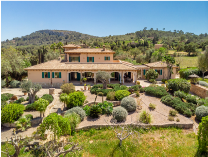
Außenansicht der Finca