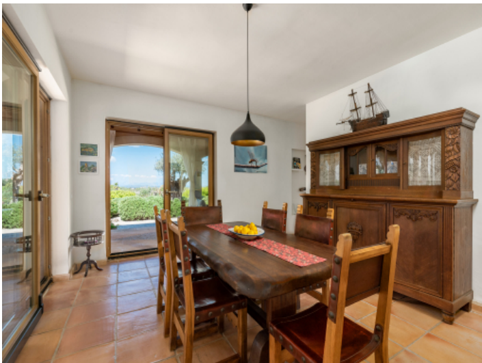
Essbereich mit Terrassenzugang