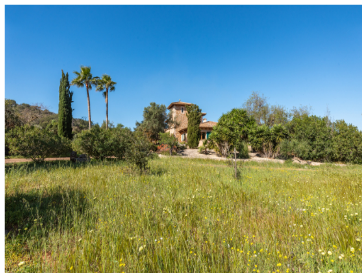
Finca inmitten von grüner Natur