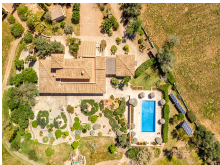
Finca von oben