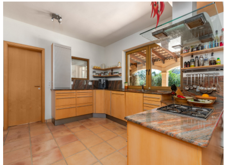
Große, offene Küche