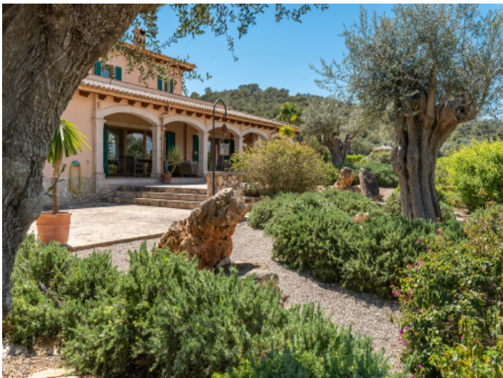
Ein mediterraner Garten umgibt die Finca