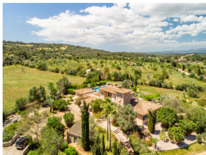
Finca von oben