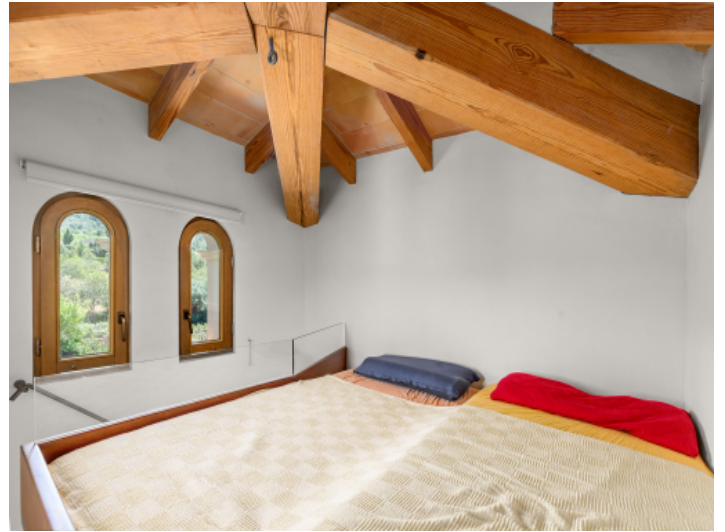
Schlafzimmer unter dem Dach