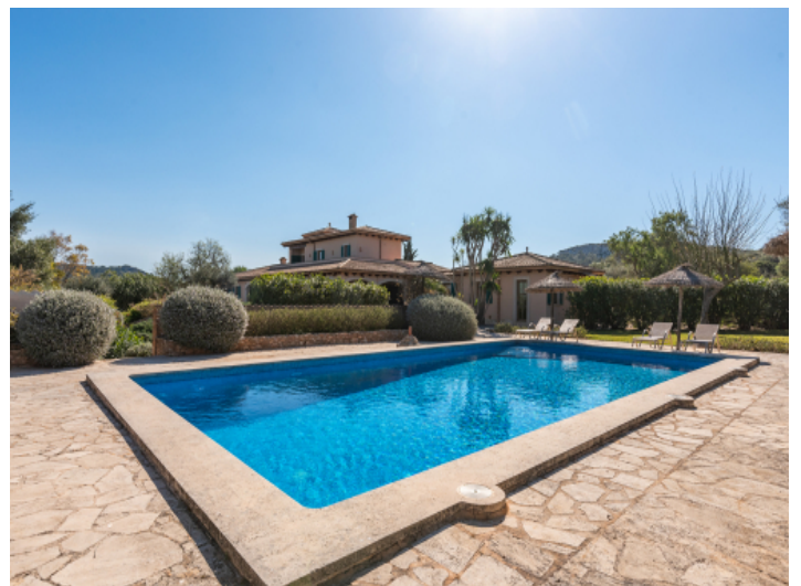
Pooloase für Sommertage