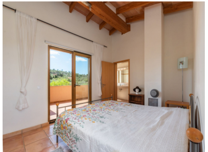
Schlafzimmer im Obergeschoss