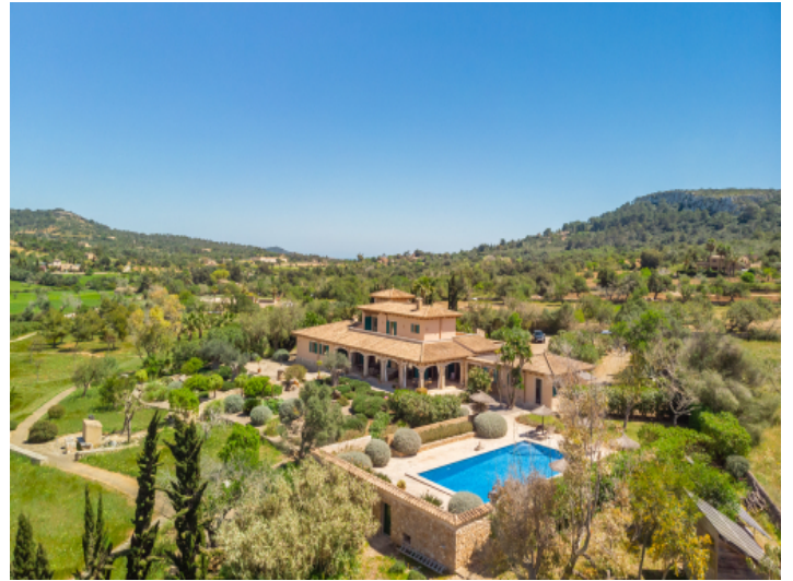
Wunderschönes Fincaanwesen mit mediterranen Garten