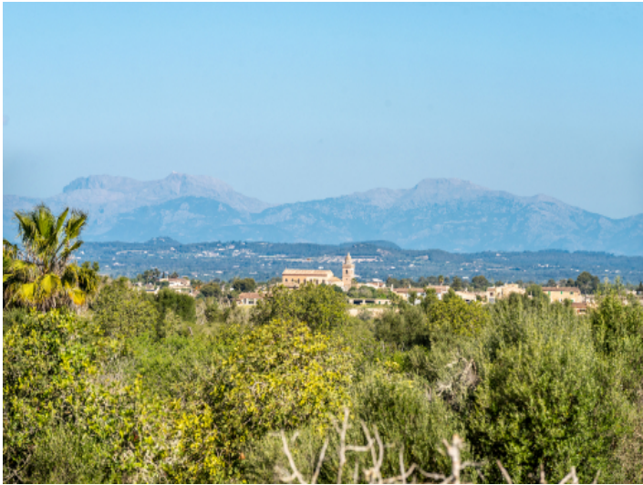
Beeindruckender Blick bis aufs Tramuntanagebirge