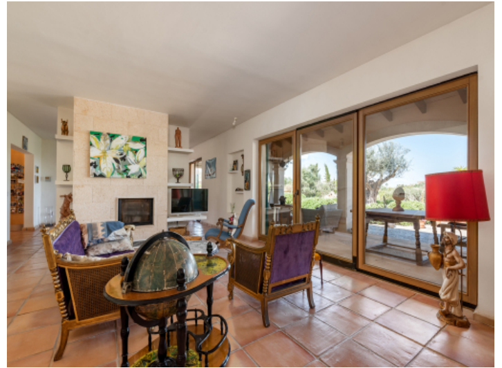
Wohnbereich mit Kamin und Terrassenzugang