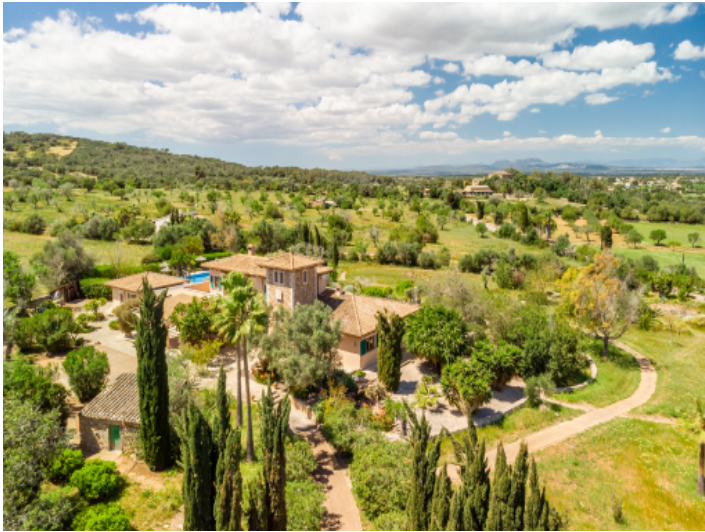
Ruhig gelegene Finca umgeben von einer malerischen Landschaft bei Cas Concos